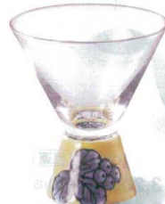
7-1311-3 陶 G ¥8,000 葡萄SAKE GLASS (台形) φ71×86 (90ml) (51529210)