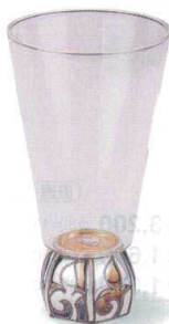
7-1311-4 陶 G ¥5,000 一合グラス六角 螺鈿唐草 φ63×120 (165ml) (89010060)