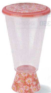
7-1311-8 陶 G ¥3,350 一合グラス台形蓋付 赤小菊 φ70×125 (165ml) (89010080)