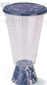
7-1311-9 陶 G ¥3,350 一合グラス台形蓋付 ペイズリー φ70×125 (165ml) (89010090)