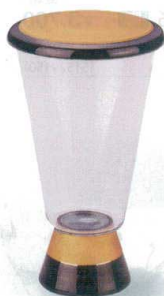
7-1311-7 陶 G ¥3,450 一合グラス台形蓋付 天目金彩 φ70×125 (165ml) (89010070)