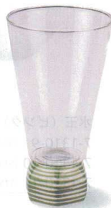
7-1311-5 陶 G ¥2,900 一合グラス六角 ライン緑 φ63×120 (165ml) (89010050)