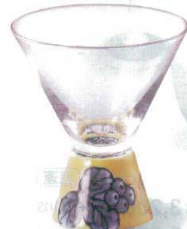
7-1311-3 陶 G ¥8,000 葡萄SAKE GLASS (台形) φ71×86 (90ml) (51529210)