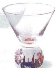
7-1311-2 陶 G ¥7,300 古伊万里風SAKE GLASS (六角) φ71×86 (90ml) (51529190)