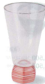
7-1311-6 陶 G ¥2,900 一合グラス六角 ライン赤 φ63×120 (165ml) (89010040)