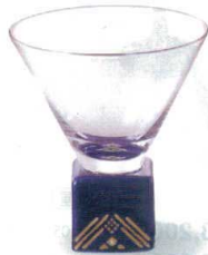
7-1311-1 陶 G ¥4,100 アズテックSAKE GLASS (正角) φ71×85 (90ml) (51529180)