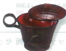
すす竹 内朱 TA 7-149-11 (31000285) 蓋 ¥940 7-149-12 (31000286) 親 ¥1,660