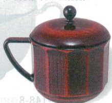
7-149-16 (31001480) ¥2,650 曙 内黒 TA (フタ ¥900) (オヤ ¥1,750)