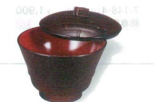
7-149-5 (31000330) ¥2,000 すす竹 内朱 (小) TA (フタ ¥940) (オヤ ¥1,060)