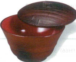
7-149-6 (31000380) ¥2,200 すす竹 内朱 (大) TA (フタ ¥1,040) (オヤ ¥1,160)