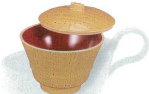
7-149-3 (31000340) ¥2,400 ゴマ竹 内朱 (小) TA (フタ ¥870) (オヤ ¥1,530)