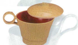
ゴマ竹 内朱 TA 7-149-9 (31000295) 蓋 ¥870 7-149-10 (31000296) 親 ¥1,930