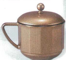
7-149-15 (30048020) ¥1,900 金梨地 内黒 TA (フタ ¥650) (オヤ ¥1,250)