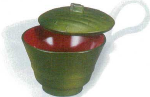
7-149-1 (31000320) ¥1,800 若竹 内朱 (小) TA (フタ ¥840) (オヤ ¥960)

小: φ103×H93 (H68) 250cc, 102g (67g) 大: φ115×H87 (H62) 295cc, 116g (74g)