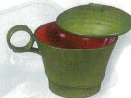
若竹 内朱 TA 7-149-7 (31000275) 蓋 ¥840 7-149-8 (31000276) 親 ¥1,510