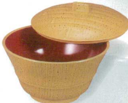
7-149-4 (31000370) ¥2,600 ゴマ竹 内朱 (大) TA (フタ ¥950) (オヤ ¥1,650)