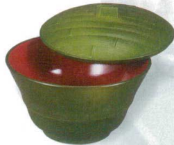
7-149-2 (31000390) ¥2,000 若竹 内朱 (大) TA (フタ ¥930) (オヤ ¥1,070)