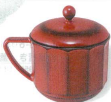
7-149-14 (31001460) ¥2,400 根来 内黒 TA (フタ ¥800) (オヤ ¥1,600)