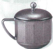
7-149-13 (30048010) ¥1,900 銀梨地 内黒 TA (フタ ¥650) (オヤ ¥1,250)