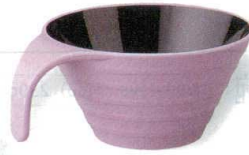
7-150-12 (90032245) ¥1,000 紫 内黒 TA