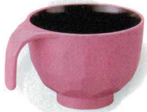
7-150-1 (90032243) ¥850 桃 内黒 TA

セット: 120×96×H94 265cc, 62g 親: 120×96×H69 265cc, 32g