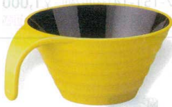
7-150-10 (90032249) ¥1,000 黄 内黒 TA