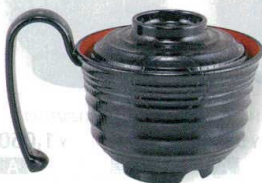
7-150-18 (31001270) ¥1,950 黒 内朱 TA (フタ ¥600) (オヤ ¥1,350)

持ち手の長さが、椀足と同じ位置で設計されているので テーブル上での安定性にも優れています。