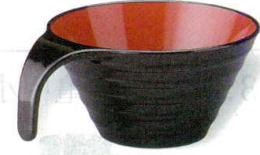
7-150-13 (17000520) ¥900 黒 内朱 TA