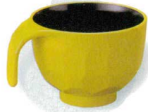
7-150-3 (90032244) ¥850 黄 内黒 TA