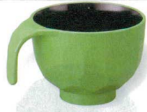
7-150-6 (90032241) ¥850 緑 内黒 TA