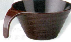
7-150-16 (17000510) ¥900 新溜 内黒 TA