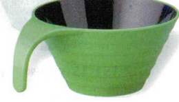
7-150-17 (90032246) ¥1,000 緑 内黒 TA