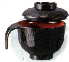
黒 内朱 TA 7-150-4 (17000530) (親のみ) ¥850 7-150-5 (30004010) (蓋のみ) ¥650