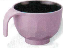
7-150-7 (90032240) ¥850 紫 内黒 TA