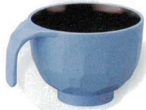
7-150-2 (90032242) ¥850 青 内黒 TA