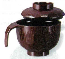
新溜 内黒 TA 7-150-8 (17000540) (親のみ) ¥800 7-150-9 (30004020) (蓋のみ) ¥650