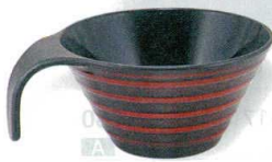
7-150-14 (31001360) ¥1,250 研出曙 内黒 TA