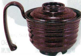
7-150-20 (31001300) ¥2,400 溜 内黒 TA (フタ ¥840) (オヤ ¥1,560)