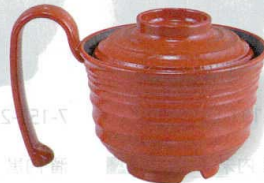
7-150-19 (31001280) ¥2,100 柿朱 内黒 TA (フタ ¥630) (オヤ ¥1,470)