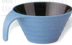
7-150-11 (90032247) ¥1,000 青 内黒 TA