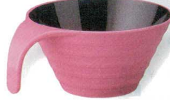
7-150-15 (90032248) ¥1,000 桃 内黒 TA