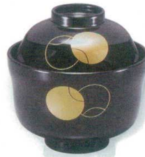
7-177-11 (33023340) ¥3,500 黒/つぼつぼ内黒 TA