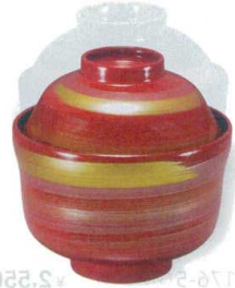
7-177-8 (33023380) ¥3,200 朱/一筆かすり内黒 TA