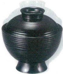
7-177-1 (37001220) ¥1,600 黒内朱 TA