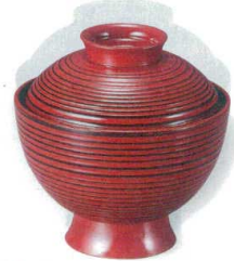
7-177-4 (37001230) ¥2,100 朱研出し内黒 TA