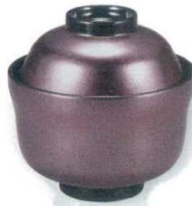
7-177-10 (30044930) ¥3,050 サテン紫銀内黒 TA