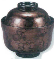
7-177-9 (30044940) ¥2,950 グレー刷毛八雲内黒 TA