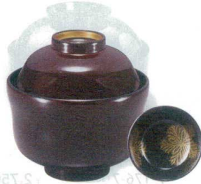
7-177-6 (33023320) ¥3,200 溜高台内金見返忍内黒 TA