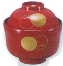
7-177-12 (33023330) ¥3,500 朱/つぼつぼ内黒 TA