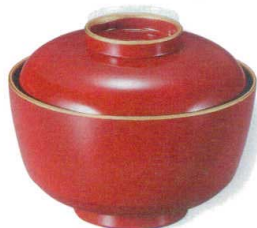
7-177-13 (37001660) ¥3,500 朱天金内黒 黒内厨 木質