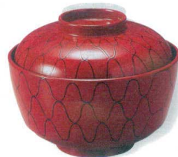
7-177-15 (12024540) ¥4,700 朱/アミメ内黒 黒一日 木質