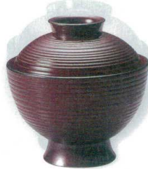
7-177-2 (33020020) ¥1,750 溜内朱 TA