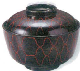
7-177-14 (12024550) ¥4,700 黒/アミメ内黒 黒内漆 木質