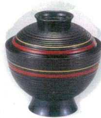
7-177-3 (33020010) ¥1,800 黒/朱金ライン内朱 TA