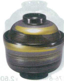
7-177-7 (33023370) ¥3,200 黒/一筆かすり内黒 TA