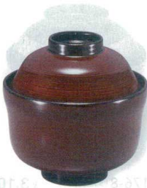
7-177-5 (33023310) ¥2,100 溜刷毛目内黒 TA