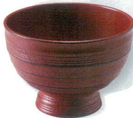
7-217-3 (21080190) 総根来 ¥2,150