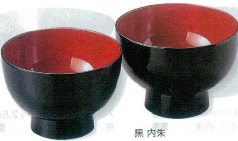
黒内朱 7-217-5 (33102045) 4.3寸 ¥1,600 7-217-6 (33102065) 4.5寸 ¥1,650