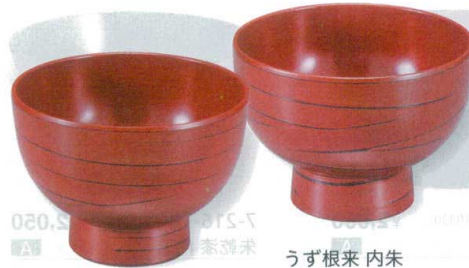
うず根来内朱 7-217-7 (33102040) 4.3寸 ¥1,850 7-217-8 (33102060) 4.5寸 ¥2,050