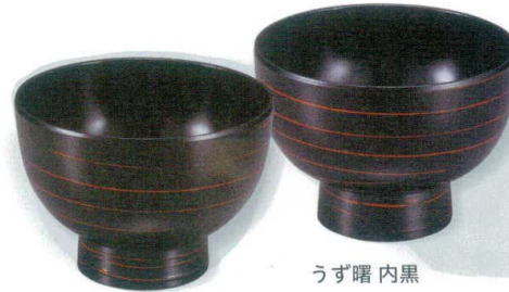
うず曙内黒 7-217-11 (33102030) 4.3寸 ¥1,850 7-217-12 (33102050) 4.5寸 ¥2,050