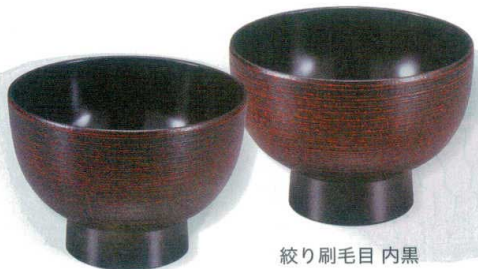
絞り刷毛目内黒 7-217-9 (45150720) 4.3寸 ¥1,950 7-217-10 (45150730) 4.5寸 ¥2,150