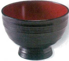
7-217-1 (33711010) 黒内朱 ¥1,700