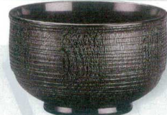
7-235-7 (39020462) ¥950 黒(内黒) A