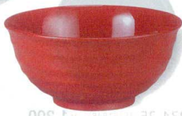
7-235-14 (55000560) ¥700 外朱乾漆/内朱 A