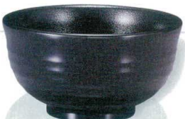
7-235-9 (33024620) ¥950 外黒/内はじき黒 A