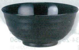
7-235-13 (55000550) ¥700 外黒乾漆/内黒 A