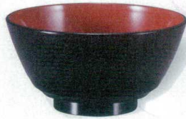
7-235-1 (31007020) ¥800 黒内朱 TA