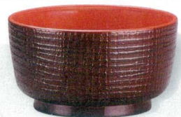
溜(内朱) A TA 7-235-5 (32603302) ¥600 7-235-6 (12033972) 耐熱 ¥680