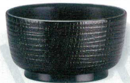
黒(内黒) A TA 7-235-3 (32603282) ¥450 7-235-4 (12033952) 耐熱 ¥550