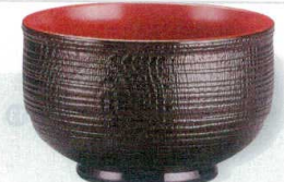
7-235-8 (39020472) ¥1,200 溜内朱 A