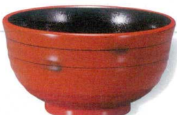
7-235-10 (33024640) ¥1,100 根来/内はじき黒 A