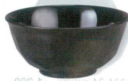
7-235-15 (55000530) ¥700 外黒乾漆/内黒 A