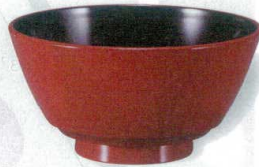
7-235-2 (31007030) ¥800 朱内黒 TA