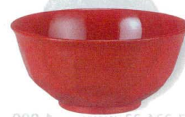
7-235-16 (55000540) ¥700 外朱乾漆/内朱 A