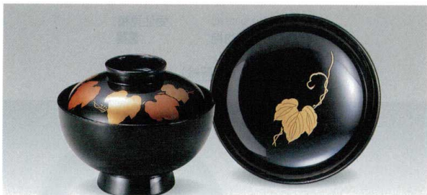
7-268-3 (33603050) 受注見積 木製4.2寸 吸物椀 木 黒／蔦 (本手塗漆手描き蒔絵) φ120×100