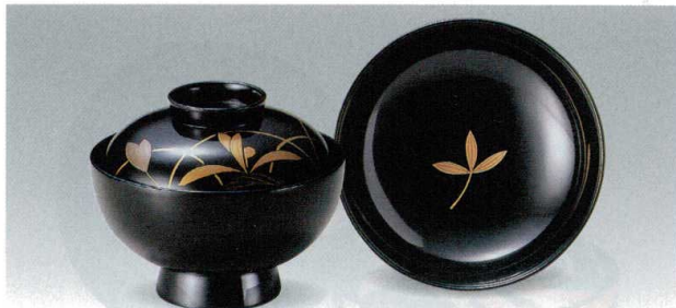
7-268-1 (33603000) 受注見積 木製4.2寸 吸物椀 木 黒／茶金蘭 (本手塗漆手描き蒔絵) φ120×100