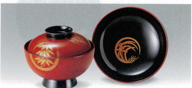
7-268-8 (33603040) 受注見積 木製4.2寸 吸物椀 木 朱／四君子花丸 (本手塗漆手描き蒔絵) φ120×100