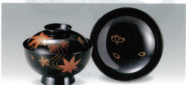
7-268-6 (33602980) 受注見積 木製4.2寸 吸物椀 木 黒／立田川春秋 (本手塗漆手描き蒔絵) φ120×100