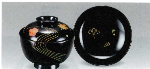
7-268-4 (31002460) 受注見積 木製3.8寸 吸物椀 木 黒／春秋立田川 (本手塗漆手描き蒔絵) φ115×102