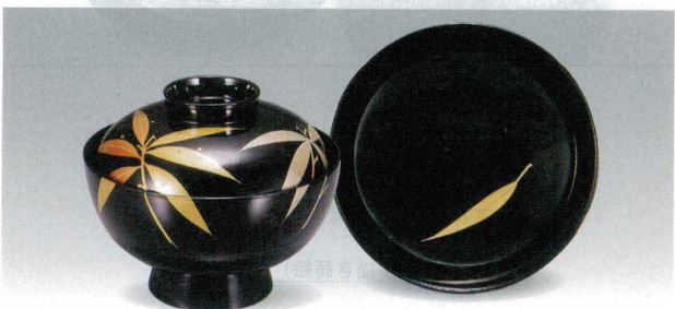
7-268-5 (31002680) 受注見積 木製4.2寸 吸物椀 木 黒／金銀笹 (本手塗漆手描き蒔絵) φ121×99