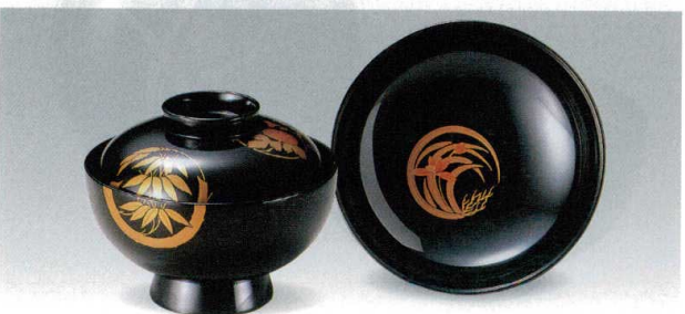
7-268-7 (33603030) 受注見積 木製4.2寸 吸物椀 木 黒／四君子花丸 (本手塗漆手描き蒔絵) φ120×100