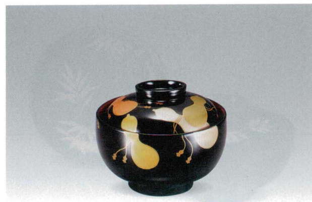
7-272-5 (31003060) 受注見積 木製 布袋煮物椀 木 黒/六瓢 内朱 (本手塗漆手描き蒔絵) φ124×101