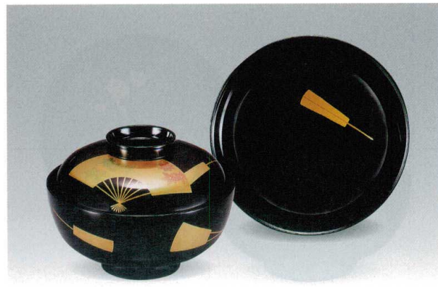
7-272-4 (31002740) 受注見積 4.2寸 吸物椀 木 黒/扇面春秋 (本手塗漆手描き蒔絵) φ123×91