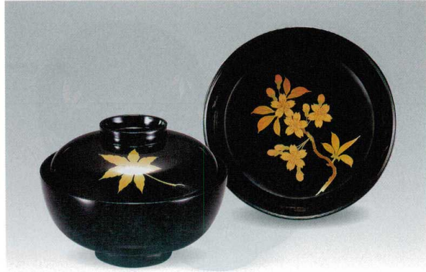
7-272-2 (31002750) 受注見積 4.2寸 吸物椀 木 黒/春秋見返し桜 (本手塗漆手描き蒔絵) φ125×91