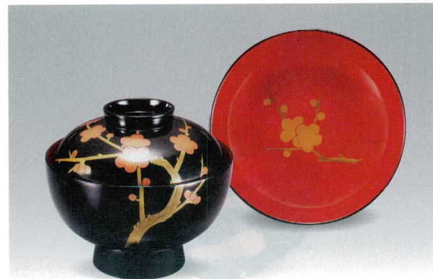
7-272-6 (31003010) 受注見積 木製 雑煮椀 木 黒/枝梅 内朱 (本手塗漆手描き蒔絵) φ132×112