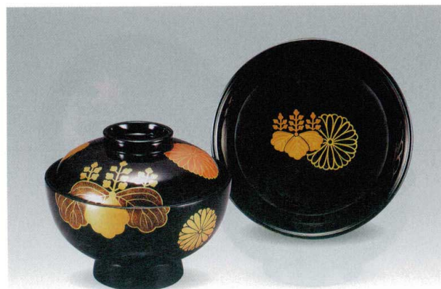
7-272-3 (31002840) 受注見積 4.2寸 吸物椀 木 黒/高台寺見返菊 (本手塗漆手描き蒔絵) φ122×100