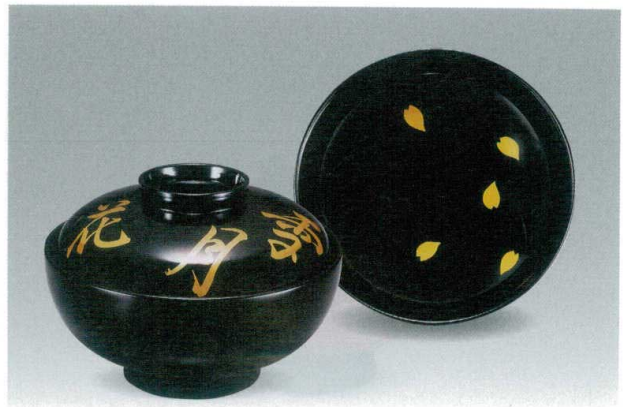
7-273-2 (31003040) 受注見積 木製 煮物椀 木 黒/雪月花 (本手塗漆手描き蒔絵) 径φ137×94