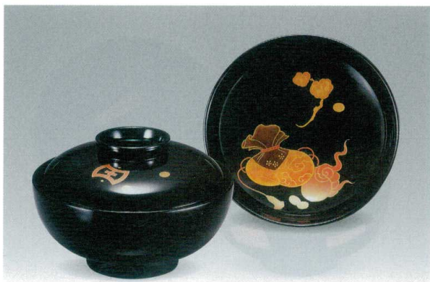
7-273-3 (31002870) 受注見積 木製4.5寸 煮物椀 木 黒/宝尽くし (本手塗漆手描き蒔絵) 径φ137×91