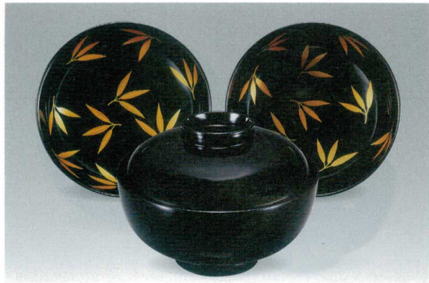
7-273-1 (31002850) 受注見積 木製 仙才椀 木 黒/見返し笹 (本手塗漆手描き蒔絵) 径φ124×90