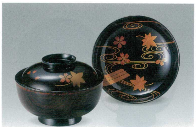
7-273-4 (33603290) 受注見積 木製4.3寸 玉淵付仙才椀 木 木地呂/花筏 (本手塗漆手描き蒔絵) 径φ130×100