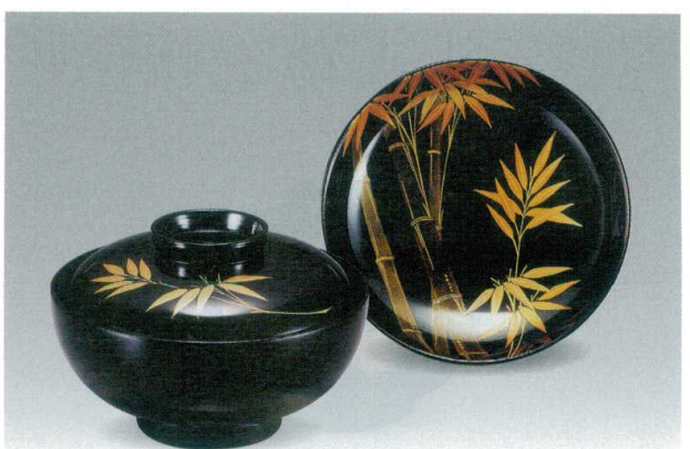
7-273-6 (31002910) 受注見積 木製4.5寸 煮物椀 木 黒/竹切金入 (本手塗漆手描き蒔絵) 径φ137×89