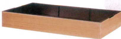
7-279-1 (70022470) 白木柾目 530×325×83