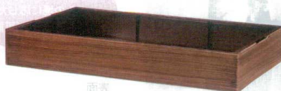
7-279-2 (70022450) チーク柾目 530×325×83