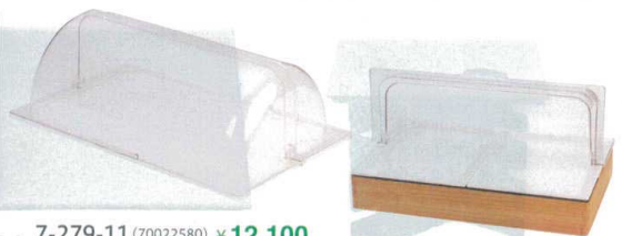
7-279-11 (70022580) ¥12,100 1/1カバー長角 透明 530×330×180