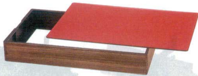
ビュッフェ用ABS枠と皿が セット可能