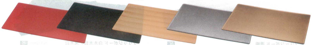
7-279-4 (70022510) ¥5,300 朱パール 530×330×10