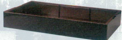
7-279-3 (70022460) 黒パール 530×325×83