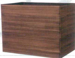
スタッキング可能