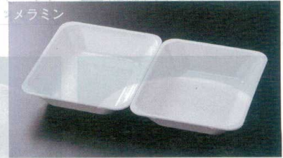
メラミン 7-297-13 (70020340) ¥5,500 1/2フードパン(1ケ) (直運) メラミン 白 329×265×65