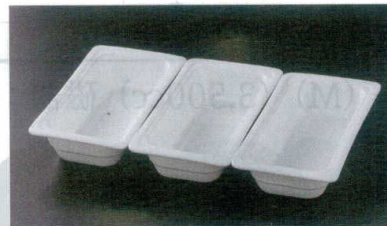
7-297-16 (70020210) ¥5,500 1/3ガストロノーム (直運) 陶 白 325×170×67