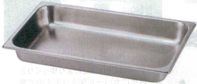
フードパン長角 (直運) ST 7-297-4 (80114440) 1/1 ¥4,500 530×327×65 7-297-5 (80114450) 2/3 ¥4,000 354×327×65 7-297-6 (80114460) 1/2 ¥4,000 327×265×65 7-297-7 (80114470) 1/3 ¥3,300 176×327×65