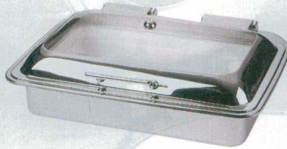
7-297-2 (80114420) ¥107,000 1/1長角チェーフィングディッシュ (直運) ST ガラス蓋付 590×450×192