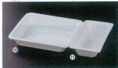
10 11 ガストロノーム 白 (直運) 陶 7-297-10 (70020190) 2/3 ¥9,000 355×320×62 7-297-11 (70020210) 1/3 ¥5,500 325×170×67