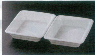
7-297-12 (70020330) ¥8,200 1/2ガストロノーム (直運) 陶 白 330×263×65