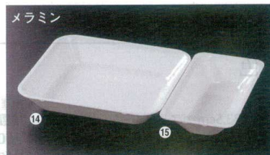
メラミン 14 15 フードパン(1ケ) 白 (直運) メラミン 7-297-14 (70020220) 2/3 ¥10,300 354×329×65 7-297-15 (70020230) 1/3 ¥7,200 329×176×65