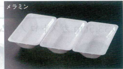
メラミン 7-297-17 (70020230) ¥7,200 1/3フードパン(1ケ) (直運) メラミン 白 329×176×65