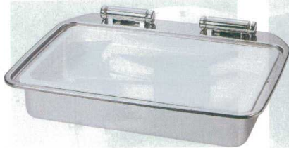
7-297-1 (80114410) ¥81,000 1/1長角チェーフィングディッシュ (直運) ST 蓋なし 590×450×140