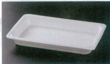
7-297-8 (70020310) ¥19,000 1/1ガストロノーム (直運) 陶 白 530×320×65