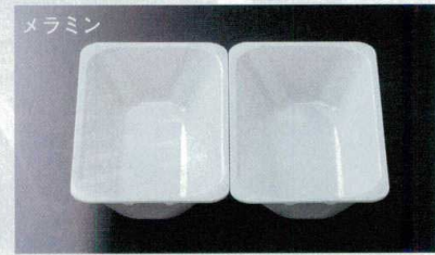
メラミン 7-306-3 (70020230) ¥7,200 1/3フードパン角(1ヶ) (直運) 珐瑯 白 329×176×65