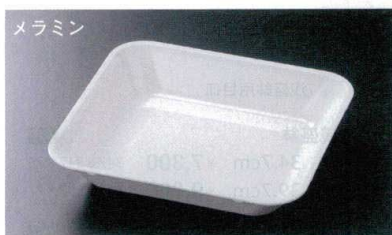
メラミン 7-306-4 (70020220) ¥10,300 2/3フードパン角 (直運) 珐瑯 白 354×329×65