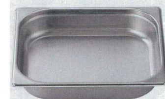
7-306-9 (70020830) ¥9,000 2/3ステンレスフードパン角型 (直運) ST 335×325×65