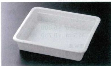
7-306-1 (70020810) ¥17,000 2/3ガストロノーム角 (直運) 陶 白 354×325×65