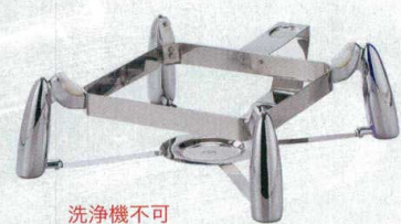
洗浄機不可 7-306-10 (70020840) ¥47,000 2/3チェーフィングスタンド角型 (直運) ST 455×405×140