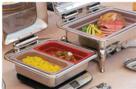
(直運) 1/3ガストロノーム角(深) 325×176×71 陶 7-306-7 (80115030) ブラック ¥7,800 7-306-8 (80115040) レッド ¥7,800