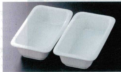
7-306-2 (70020820) ¥14,700 1/3ガストロノーム角(1ヶ) (直運) 陶 白 338×180×75