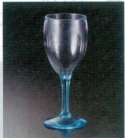
7-325-5 (81017485) ¥1,700 ブルーボカシ PCT φ48×120 60cc