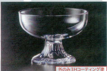
7-325-9 (81017750) ¥2,400 クリア/コーティング PCT φ96×70 160cc