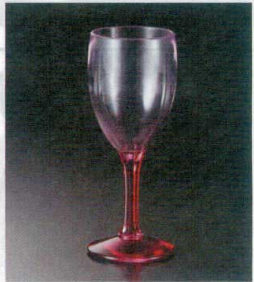
7-325-7 (81017487) ¥1,700 レッドボカシ PCT φ48×120 60cc