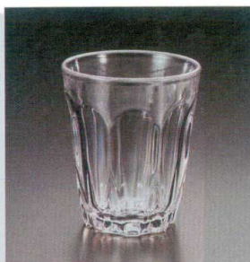
7-325-1 (12010140) ¥900 クリアOM PCT φ60×70 90cc