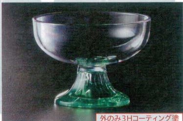
7-325-11 (81017770) ¥2,500 グリーンボカシ PCT φ96×70 160cc