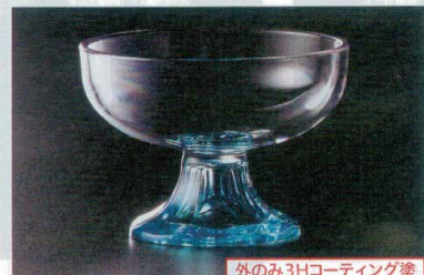
7-325-10 (81017760) ¥2,500 ブルーボカシ PCT φ96×70 160cc