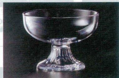
7-325-8 (81017740) ¥1,850 クリア PCT φ96×70 160cc