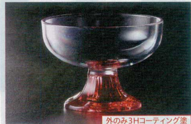
7-325-12 (81017780) ¥2,500 レッドボカシ PCT φ96×70 160cc