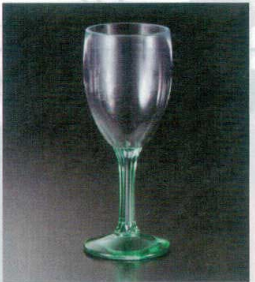
7-325-6 (81017486) ¥1,700 グリーンボカシ PCT φ48×120 60cc