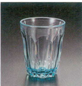
7-325-2 (12010150) ¥1,350 ブルーボカシ PCT φ60×70 90cc