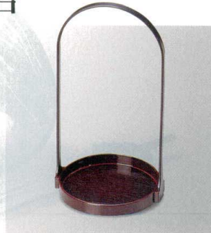
7-466-2 (51214220) ¥830 3.5寸丸手提台(高手付) A 新溜 107×115×225