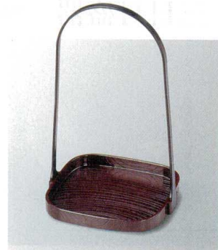
7-466-4 (51214240) ¥900 4寸くつわ手提台(高手付) A 新溜 125×132×225