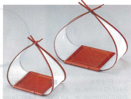
朱 A 7-466-13 (51304190) 小 ¥2,500 7-466-14 (51304200) 大 ¥2,950