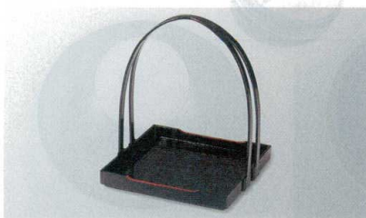
7-466-8 (51023510) ¥950 手提付ミニ盆 黒天朱 A