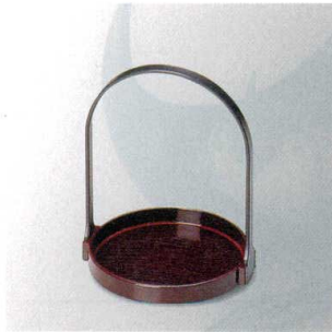
7-466-1 (51214210) ¥720 3.5寸丸手提台(低手付) A 新溜 107×115×155