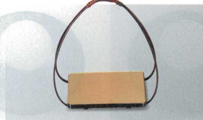
7-466-9 (51272281) ¥2,900 黒金パール A