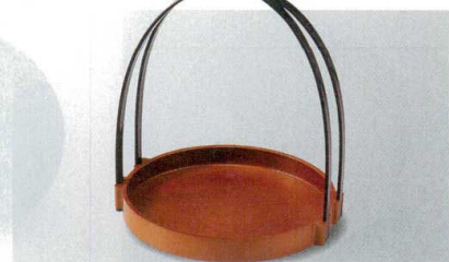
7-466-10 (55203905) ¥1,650 ブラウン A

ブレットフェ 盛箱 盛込 オードブル 盛器・盛皿 粋(金・銀・銅) 小鉢・焼物皿