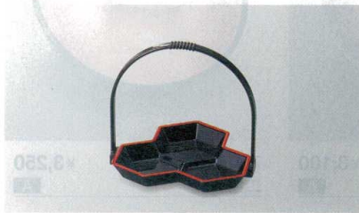
7-466-5 (93105890) ¥630 亀甲手提げ珍味盛器 天朱黒OM A