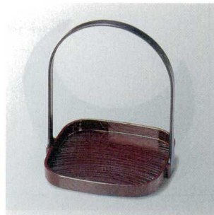
7-466-3 (51214230) ¥800 4寸くつわ手提台(低手付) A 新溜 125×132×167