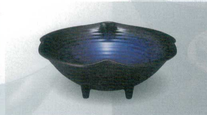
7-471-2 (51400720) ¥2,700 ブルー彩 TA