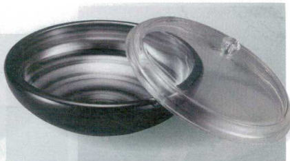
ドーム鉢 銀渦 TA (74011630) 耐熱本体 ¥4,550 Aタイプ(蓋) クリスタル ¥1,600