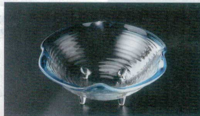
7-471-6 (51014210) ¥2,600 ブルーぼかし AC