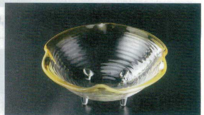
7-471-7 (51014220) ¥2,600 イエローぼかし AC