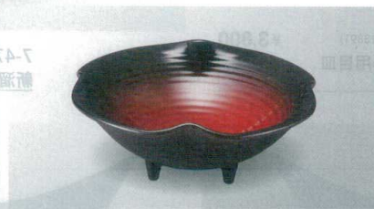
7-471-4 (74011650) ¥4,300 朱黒ぼかしSH塗 TA