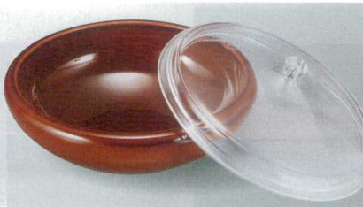
ドーム鉢 漆調春慶塗 TA (51272194) 耐熱本体 ¥3,400 Aタイプ(蓋) クリスタル ¥1,600