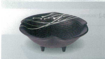
7-471-3 (50023965) ¥3,200 黒タタキ白乱糸 TA