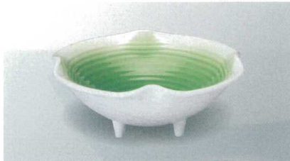
7-471-1 (51400710) ¥2,500 グリーン TA