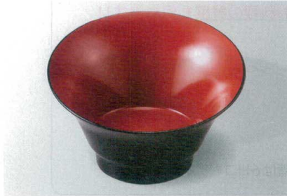
7-473-1 (50001230) ¥1,700 内朱外黒 TA