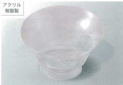
7-473-6 (50001270) ¥1,700 透明(全面クリア) AC