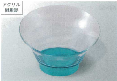
7-473-7 (50001280) ¥1,900 スカイブルー AC