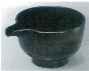
7-473-9 (15158540) ¥2,300 うず曙 A