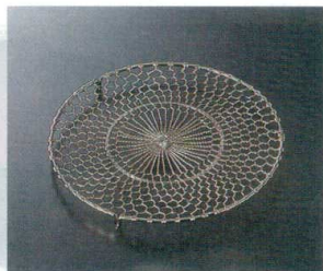
7-473-11 (92976340) ¥2,700 φ105龍宮あみ目皿 銀 ST