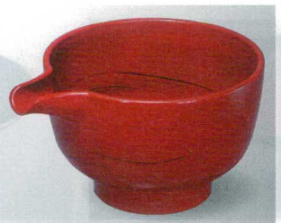
7-473-10 (15158570) ¥2,300 うず根来 A