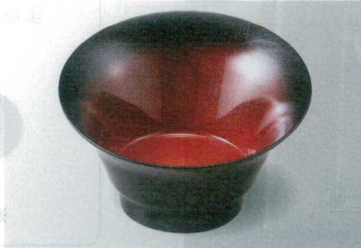
7-473-2 (50001235) ¥1,900 内黒朱ぼかし外黒 TA