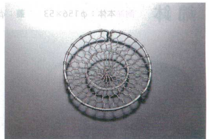
7-473-8 (90002590) ¥3,100 φ75龍宮あみ目皿 銀 ST