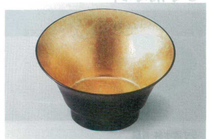
7-473-5 (50001260) ¥3,700 内二色金箔外黒 TA