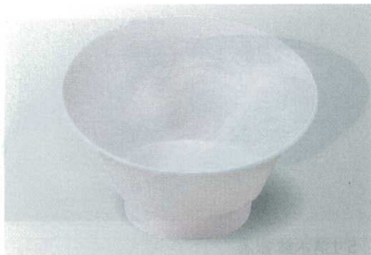
7-473-3 (50001240) ¥2,400 内外ホワイトアクア TA