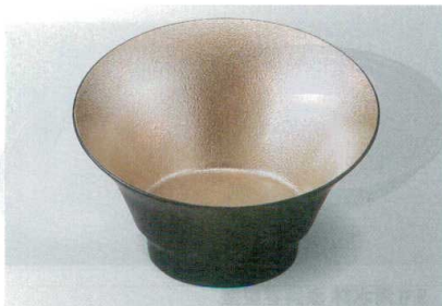
7-473-4 (50001250) ¥2,700 内銀彩外黒 TA