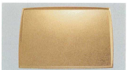
わたらせ盆 タタキ金SL / 裏黒塗 A 7-48-34 (17418990) 尺3 ¥4,700 390×284×13 7-48-35 (17419000) 尺4 ¥5,400 284×305×13