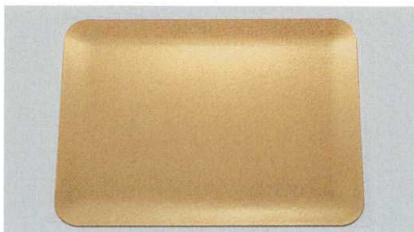
耐熱寿盆 タタキ金SL / 裏黒塗 TA 7-48-22 (17418900) 尺2 ¥4,950 357×261×14 7-48-23 (17418910) 尺3 ¥5,700 384×291×15 7-48-24 (17418920) 尺4 ¥6,100 414×321×16