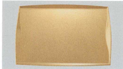
耐熱測付ウェーブトレイ タタキ金SL / 裏黒塗 TA 7-48-3 (17418610) 尺1 ¥4,200 330×234×19 7-48-4 (17418620) 尺2 ¥4,750 360×256×21 7-48-5 (17418630) 尺3 ¥5,250 390×277×23 7-48-6 (17418640) 尺4 ¥5,950 420×299×25