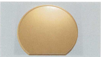
雲流半月盆 タタキ金 / 裏黒塗 A 7-48-28 (17419320) 尺1 ¥3,900 332×302×10 7-48-29 (17419330) 尺2 ¥4,500 364×329×10 7-48-30 (17419340) 尺3 ¥4,950 393×368×10 7-48-31 (17419350) 尺4 ¥5,900 425×385×10