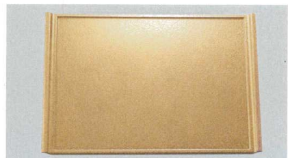
フライト盆 タタキ金SL / 裏黒塗 A 7-48-15 (17418440) 尺2 ¥4,550 373×255×18 7-48-16 (17418450) 尺3 ¥5,050 394×276×19 7-48-17 (17418460) 尺4 ¥5,650 425×301×20