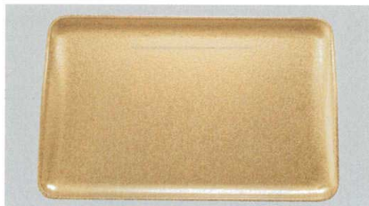
スレンダートレイ タタキ金SL / 裏黒塗 A 7-48-11 (17418730) 尺1 ¥4,100 330×180×22 7-48-12 (17418740) 尺2 ¥4,600 360×243×22 7-48-13 (17418750) 尺3 ¥5,150 390×273×22 7-48-14 (17418760) 尺4 ¥5,550 420×294×22