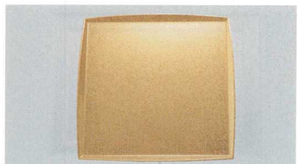
角わたらせ盆 タタキ金SL / 裏黒塗 A 7-48-25 (17419050) 9寸 ¥3,800 270×270×13 7-48-26 (17419060) 尺0 ¥4,200 300×300×13 7-48-27 (17419070) 尺1 ¥4,650 330×330×13