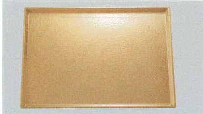
清流無地盆 タタキ金SL / 裏黒塗 A 7-48-1 (17418850) 尺3 ¥5,050 395×285×15 7-48-2 (17418860) 尺4 ¥5,500 426×307×16