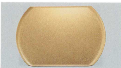
浪漫小判トレイ タタキ金SL / 裏黒塗 A 7-48-32 (17419140) 尺3 ¥5,000 390×280×13 7-48-33 (17419150) 尺4 ¥5,500 420×303×14