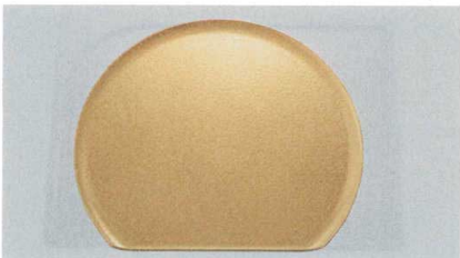
浪漫半月盆 タタキ金SL / 裏黒塗 A 7-48-18 (17419200) 8.5寸 ¥3,750 260×226×12 7-48-19 (17419210) 尺2 ¥4,650 360×310×10 7-48-20 (17419220) 尺3 ¥5,200 389×335×12 7-48-21 (17419230) 尺4 ¥5,750 419×361×14