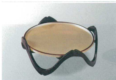
7-507-4 (55204350) ¥3,450 黄金銀彩天べっ甲