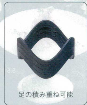
足の積み重ね可能