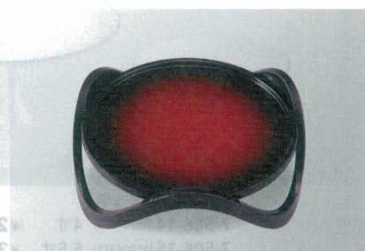
7-507-8 (51310148) ¥2,950 朱黒ぼかしSH塗