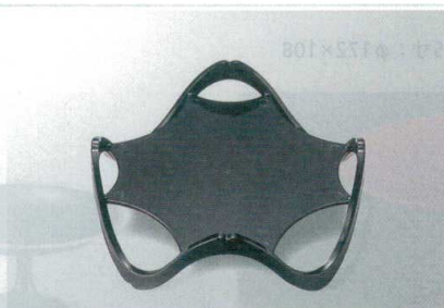
7-507-5 (51310590) ¥850 盆情盛器底板付足 黒OM 178×178×67