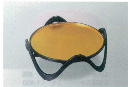
7-507-3 (55002205) ¥2,900 金粉蒔き