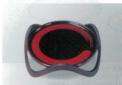
7-507-6 (51310136) ¥2,100 黒に朱一筆