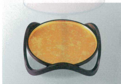
7-507-9 (55204360) ¥3,200 二色金箔