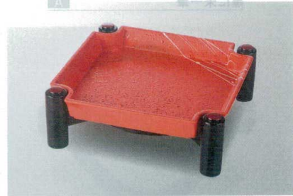
朱タタキ白乱糸 7-509-11 (50025755) 盛皿のみ ¥2,900 7-509-12 (51011720) 低足 ¥1,200 7-509-13 (51011710) 高足 ¥1,650