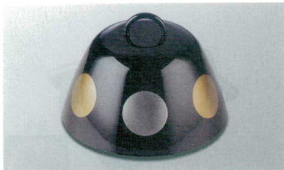
7-509-1 (53290220) ¥2,900 5寸リングフードキャップ 日月 φ160×105