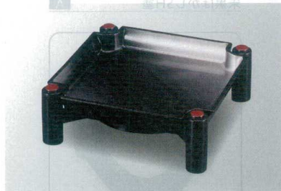
黒銀ぼかし 7-509-5 (51272337) 盛皿のみ ¥1,800 7-509-6 (51011720) 低足 ¥1,200 7-509-7 (51011710) 高足 ¥1,650