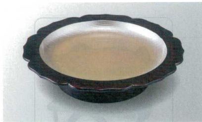
7-509-2 (55204500) ¥3,050 黄金銀彩天べっ甲