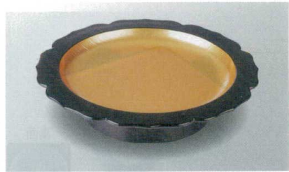
7-509-4 (51062345) ¥3,350 金粉蒔刷毛目