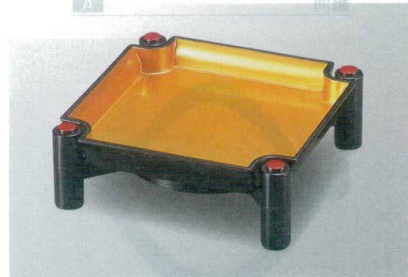
金粉蒔 7-509-8 (51400370) 盛皿のみ ¥2,600 7-509-9 (51011720) 低足 ¥1,200 7-509-10 (51011710) 高足 ¥1,650