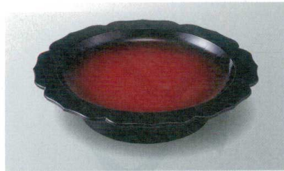
7-509-3 (55204505) ¥3,800 朱黒ぼかしSH塗