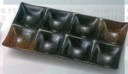
7-513-3 (51037960) ¥2,350 焼き締め裏黒塗 A