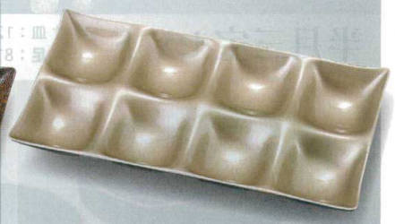
7-513-4 (51037980) ¥2,350 シャンパンゴールド裏黒塗 A