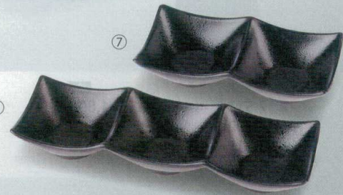
黒タキ裏黒塗 A 7-513-7 (50025770) 二点 ¥1,200 7-513-8 (50025775) 三点 ¥1,500