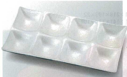
7-513-2 (51037970) ¥2,350 ホワイトアクア裏黒塗 A