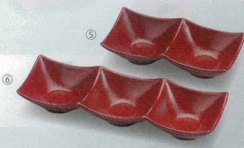
朱ゆず天目裏朱塗 A 7-513-5 (45158200) 二点 ¥1,050 7-513-6 (45158210) 三点 ¥1,350