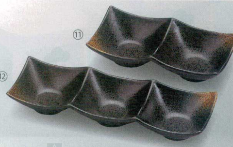
焼き締め裏黒塗 A 7-513-11 (45158220) 二点 ¥1,200 7-513-12 (45158230) 三点 ¥1,550