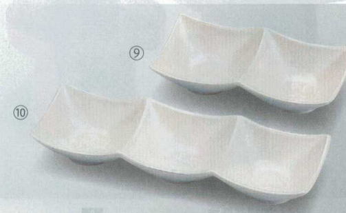
ホワイトアクア裏白塗 A 7-513-9 (45158260) 二点 ¥1,150 7-513-10 (45158270) 三点 ¥1,550