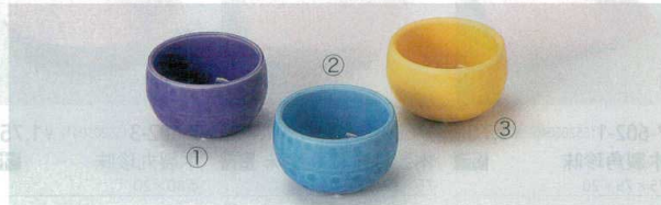
三ツ足丸珍味入(小) φ45×30 陶 7-603-1 (89804780) マロン釉 ¥650 7-603-3 (89804800) 黄釉 ¥650 7-603-2 (89804790) トルコ釉 ¥650