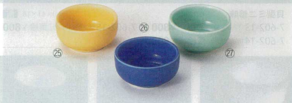
丸切立小付 φ56×28 陶 7-603-25 (89804870) 黄釉 ¥650 7-603-27 (89804890) 青磁 ¥650 7-603-26 (89804880) 瑠璃釉 ¥650