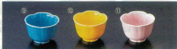
梅型珍味(小) φ52×35 陶 7-603-9 (89600380) ブルー ¥650 7-603-11 (89600400) ピンク ¥650 7-603-10 (89600390) 黄釉 ¥650