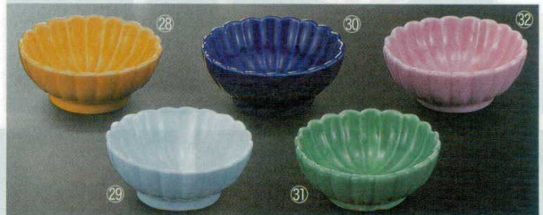
菊鉢(中) φ80×32 陶 7-603-28 (89770010) 黄釉 ¥900 7-603-31 (12015170) グリーン ¥900 7-603-29 (89770000) 青磁 ¥900 7-603-32 (12015180) ピンク ¥900 7-603-30 (89770020) 瑠璃 ¥900