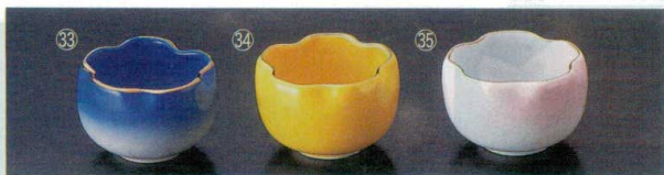
桜型珍味 (大) 和製磁器三壁燧 φ62×40 陶 7-603-33 (89670660) ブルー測金 ¥1,100 7-603-35 (89670640) ピンク測金 ¥1,100 7-603-34 (89670650) 黄測金 ¥1,100