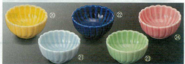
菊鉢(小) φ73×30 陶 7-603-20 (12015160) 黄釉 ¥750 7-603-23 (12015140) グリーン ¥750 7-603-21 (12015120) 青磁 ¥750 7-603-24 (12015150) ピンク ¥750 7-603-22 (12015130) 瑠璃 ¥750