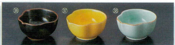
瓢鉢 和製磁器 φ8×08 φ64×67×34 陶 7-603-36 (97010150) 銀砂 ¥1,050 7-603-38 (89802120) ひわ金巻 ¥1,050 7-603-37 (89802110) 黄金巻 ¥1,050