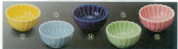
ひねり菊珍味 φ53×25 陶 7-603-12 (12015110) 黄釉 ¥550 7-603-15 (12015090) グリーン ¥550 7-603-13 (89809120) 青磁 ¥550 7-603-16 (12015100) ピンク ¥550 7-603-14 (12015080) 瑠璃 ¥550