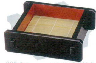
7-651-9 (45020490) ¥3,400 黒内朱 A 188×170×60