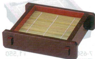
7-651-6 (46190760) ¥3,600 溜内朱 A 188×170×50