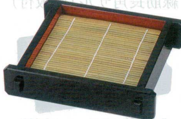
7-651-17 (45014260) ¥3,850 黒内朱 A 226×210×50