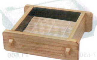
7-651-2 (40422090) ¥3,300 白木柾目 A 167×150×53