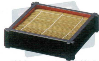
7-651-22 (45130260) ¥2,950 黒内朱 TA 180×180×49