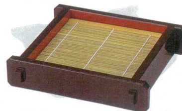
7-651-14 (46190770) ¥3,700 溜内朱 A 215×197×50