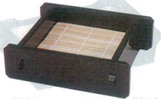
7-651-1 (40422080) ¥2,750 溜内黒塗 A 167×150×53