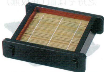
7-651-13 (45014250) ¥3,450 黒内朱 A 215×197×50