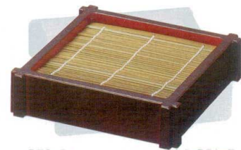
7-651-23 (45130250) ¥3,500 溜内朱 TA 180×180×49