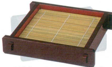
7-651-18 (46190780) ¥4,100 溜内朱 A 226×210×50