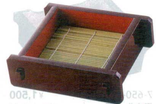
7-651-10 (46190750) ¥3,700 溜内朱 A 188×170×60