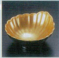
7-759-22 (22020060) ¥1,350 菊鉢 トン水 金粉蒔 A φ105×46