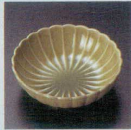
7-759-2 (22001000) ¥700 菊鉢大 うす葉色 A φ114×36