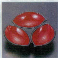
7-759-35 (70010490) ¥800 三ツ木の葉 内朱天黒 A 113×113×24