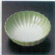
7-759-6 (22000980) ¥750 菊鉢大 若草ボカシ A φ114×36