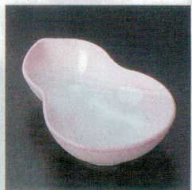
7-759-17 (22911030) ¥1,100 ひさご鉢 細 ピンクボカシ A 130×88×33