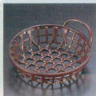
7-759-32 (22000780) ¥900 竹丸籠 溜 A φ107×41