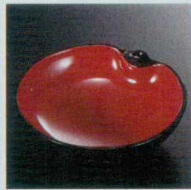
7-759-7 (24024250) ¥750 片口鉢 内朱天黒 A φ111×35