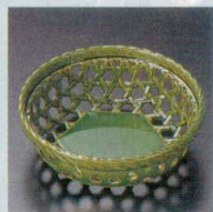
7-759-33 (22001170) ¥1,050 新丸かご 若竹 A φ112×37