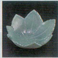
7-759-9 (22000280) ¥1,150 ヤツデ鉢 京青磁 A φ112×45