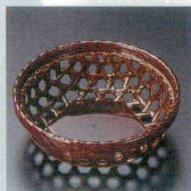
7-759-34 (22001150) ¥1,050 新丸かご 染溜 A φ112×37