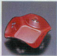
7-759-12 (70010880) ¥800 菱紋四ツ折皿 内朱天黒 A 115×115×38