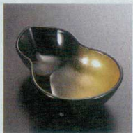
7-759-18 (24024240) ¥1,200 ひさご鉢 細 金粉蒔ぼかし A 130×88×33