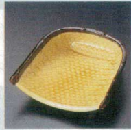
7-759-20 (22001290) ¥1,350 手み からし色 A 110×108×35