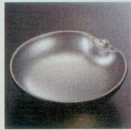
7-759-8 (24024260) ¥800 片口鉢 マットシルバー A φ111×35