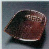
7-759-13 (22001260) ¥1,000 手み 染溜 A 110×108×35