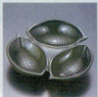
7-759-29 (70010510) ¥1,050 三ツ木の葉 織部 A 113×113×24