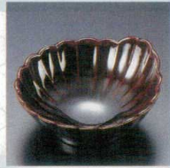
7-759-21 (22020055) ¥950 菊鉢 トン水溜 A φ105×46