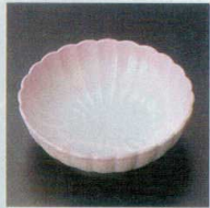
7-759-5 (22000970) ¥750 菊鉢大 ピンクボカシ A φ114×36