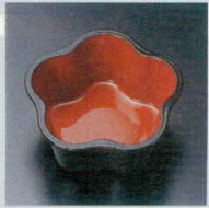
7-759-24 (22060610) ¥800 梅鉢 内朱天黒 A 106×106×40