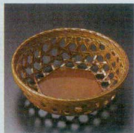
7-759-28 (22001160) ¥1,000 新丸かご からし色 A φ112×37