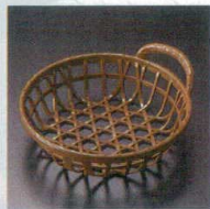
7-759-26 (22000765) ¥850 竹丸籠 からし A φ107×41