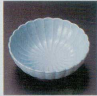
7-759-3 (22001090) ¥700 菊鉢大 青磁 A φ114×36