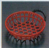
7-759-25 (70010930) ¥800 竹丸籠 朱天持ち手黒 A φ107×41