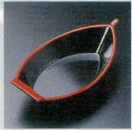
7-759-23 (22210390) ¥1,300 小舟 黒天朱 M 135×77×35