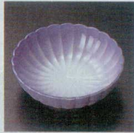
7-759-4 (22000960) ¥750 菊鉢大 コバルトボカシ A φ114×36