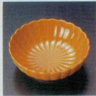
7-759-1 (22000990) ¥700 菊鉢大 黄色 A φ114×36