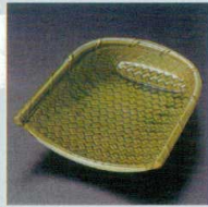
7-759-19 (22001280) ¥1,100 手み 若竹 A 110×108×35