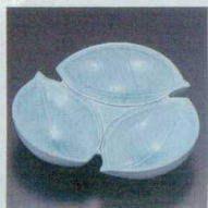
7-759-36 (70010500) ¥1,050 三ツ木の葉 青磁 A 113×113×24