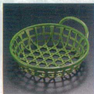
7-759-31 (22000775) ¥850 竹丸籠 若竹 A φ107×41