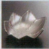
7-759-10 (24024270) ¥950 ヤツデ鉢 マットシルバー A φ112×45