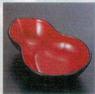
7-759-16 (70011080) ¥800 ひさご鉢 細 黒内朱 A 130×88×33