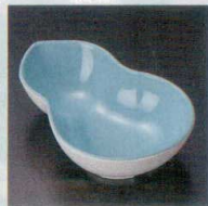
7-759-15 (22911010) ¥800 ひさご鉢 細 ブルー A 130×88×33