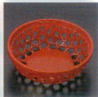
7-759-27 (70010940) ¥1,000 新丸かご 朱 A φ112×37