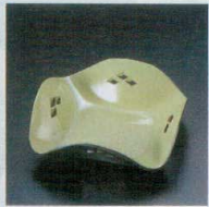
7-759-11 (22030920) ¥800 菱紋四ツ折皿 グリーン A 115×115×38