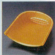
7-759-14 (22001270) ¥1,050 手み 黄釉 A 110×108×35