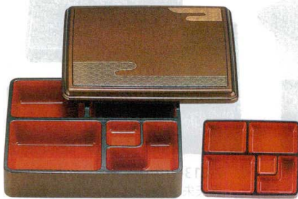
7-812-5 (23020710) ¥5,200 9寸 雲波内朱 A