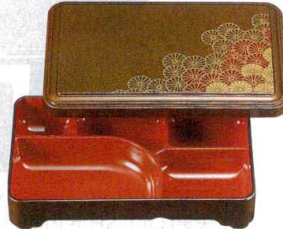
7-812-1 (23212560) ¥3,300 梨地野菊内朱 A