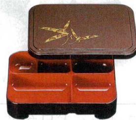
7-812-7 (23021450) ¥3,250 8寸 パール笹梅内朱 A