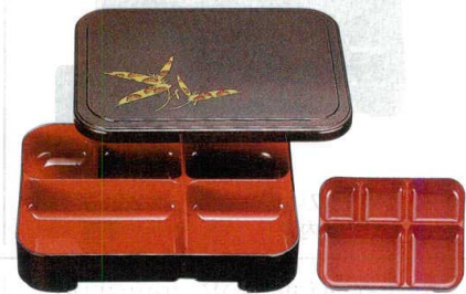
7-812-8 (23021460) ¥4,050 9寸 パール笹梅内朱 A