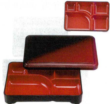
7-812-2 (23213320) ¥4,600 蓋親 朱黒ぼかしSH塗/内朱 A