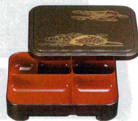
7-812-9 (23021430) ¥3,200 8寸 パール扇面菊水内朱 A