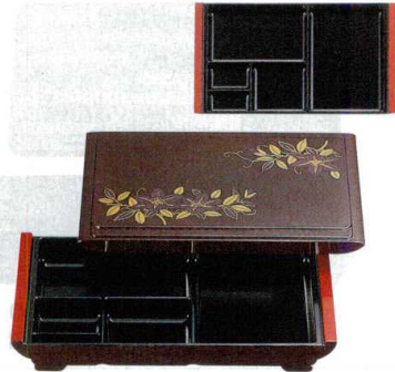
7-812-4 (23011290) ¥2,900 パール鉄仙内黒 A