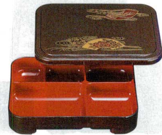
7-812-10 (23021440) ¥4,050 9寸 蓋親 パール扇面菊水内朱 A