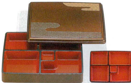
7-812-6 (23020720) ¥6,400 尺1 雲波内朱 A