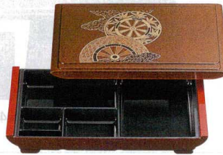
7-812-3 (23011300) ¥2,850 梨地御所車/内黒 A