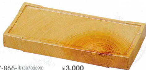
7-866-3 (53700690) ¥3,000 香林 A