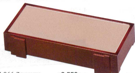
7-866-7 (53700720) ¥3,550 足付 銀透外べっ甲 A