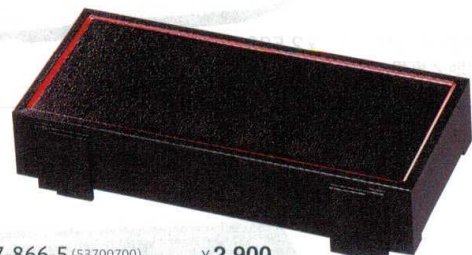
7-866-5 (53700700) ¥2,900 足付 黒内朱ラインクリアタキ A