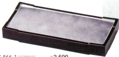
7-866-1 (53700610) ¥2,600 銀 A