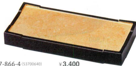
7-866-4 (53700640) ¥3,400 2色金箔 A