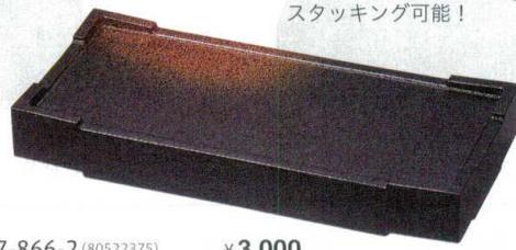
7-866-2 (80522375) ¥3,000 焼締め A