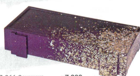
7-866-8 (46201720) ¥7,200 足付 箔舞踊 A