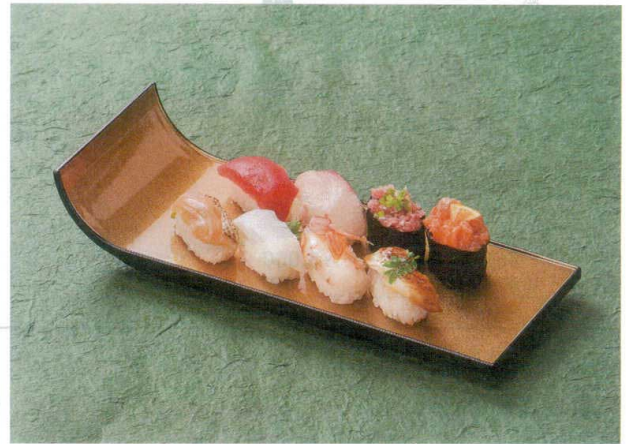
7-867-7 (30002970) ¥2,500 金詰梨地/裏黒 TA