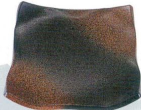
7-867-2 (55011680) ¥2,700 焼き締め A