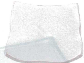
7-867-3 (55011700) ¥2,900 ホワイトアクア A