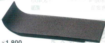
7-867-5 (30002960) ¥1,800 油滴はんてん TA