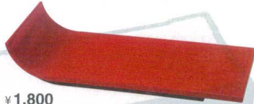
7-867-4 (46201280) ¥1,800 赤(二度塗り) TA