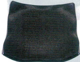
7-867-1 (55011670) ¥2,300 黒タタキ A