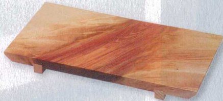
7-879-3 (55300030) ¥9,700 桧平型節付盛皿 (直運) 木 クリア塗 270×140×25