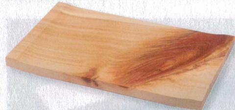
7-879-6 (55300055) ¥11,900 尺0桧横洩有節付盛皿 (直運) 木 クリア塗 300×180×30