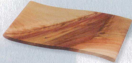
7-879-2 (55300025) ¥7,500 8寸桧ウエーブ節付皿 (直運) 木 クリア塗 240×150×15