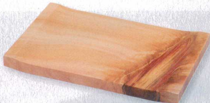
7-879-5 (55300050) ¥7,050 8寸桧横洩有節付盛皿 (直運) 木 クリア塗 240×150×30