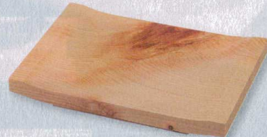
7-879-4 (55300045) ¥6,450 7寸桧横洩有節付盛皿 (直運) 木 クリア塗 210×150×30