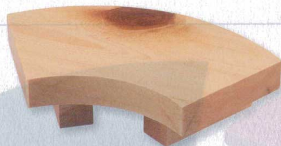
7-879-7 (55300040) ¥10,300 8.5寸桧扇型節付盛台 (直運) 木 クリア塗 260×150×57