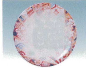
7-893-3 (74012030) 150mmφ ¥1,500 友禅風花ぼかし (タテマタ) TA