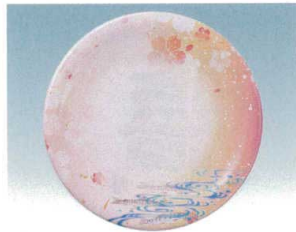
7-893-5 (74012150) 150mmφ ¥1,500 春風立田川 (タテマタ) TA