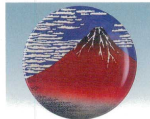
7-893-19 (46200220) 150mmφ ¥1,400 赤富士 (タテマタ) TA