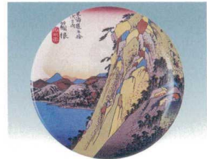
7-893-16 (46200250) 150mmφ ¥1,400 箱根 (タテマタ) TA