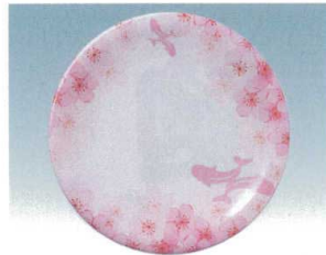
7-893-10 (74012180) 150mmφ ¥1,450 花薫 (タテマタ) TA