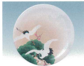
7-893-13 (74012250) 150mmφ ¥1,450 松鶴 (タテマタ) TA