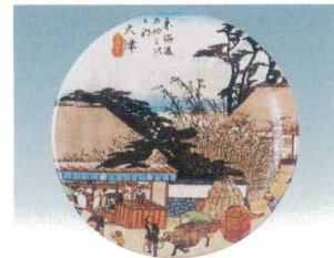
7-893-20 (46200230) 150mmφ ¥1,400 大津 (タテマタ) TA