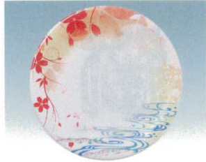
7-893-2 (74012020) 150mmφ ¥1,500 友禅風立田川 (タテマタ) TA