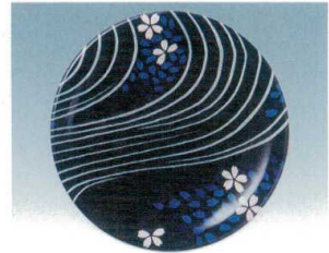
7-893-12 (74012200) 150mmφ ¥1,450 花流水 (タテマタ) TA