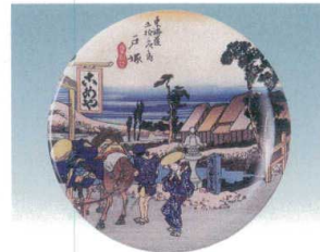
7-893-15 (46200240) 150mmφ ¥1,400 戸塚 (タテマタ) TA