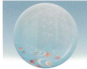
7-893-7 (74012140) 150mmφ ¥1,500 涼風立田川 (タテマタ) TA