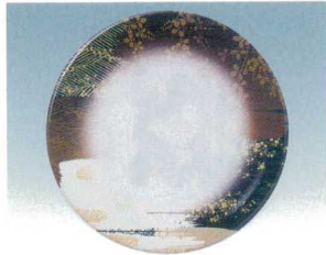
7-893-1 (74012010) 150mmφ ¥1,500 友禅風花枝垂れ (タテマタ) TA