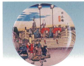
7-893-18 (46200210) 150mmφ ¥1,400 日本橋 (タテマタ) TA