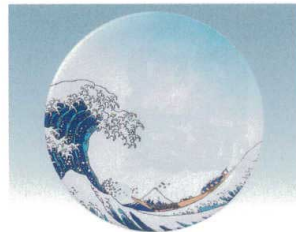
7-893-14 (74012260) 150mmφ ¥1,450 波富士 (タテマタ) TA