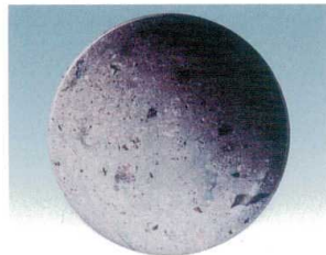
7-893-9 (74012170) 150mmφ ¥1,450 月面 (タテマタ) TA