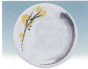
7-893-6 (74012160) 150mmφ ¥1,500 水墨 (タテマタ) TA