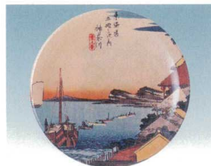
7-893-17 (46200200) 150mmφ ¥1,400 神奈川 (タテマタ) TA