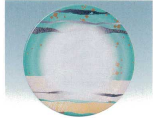
7-893-4 (74012040) 150mmφ ¥1,500 友禅風涼 (タテマタ) TA