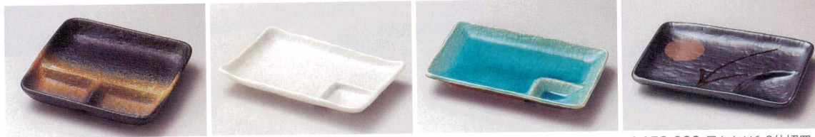
ア153-058 備前風正角仕切皿 17.8×17×3.3cm(陶)JPN 1,300円 ヤ153-068 白砂 6.0仕切皿 17×12×2.5cm(磁)(美濃焼)JPN 1,000円 オ153-078 ヒスイ仕切皿 21×13.5cm(磁)JPN 1,150円 ホ153-088 月あかり6.0仕切皿 17.5×12cm(陶)JPN 1,100円