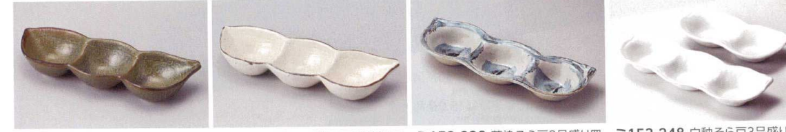
ヨ153-218 織部おふけ豆型仕切皿 20.5×7×3.2cm(陶)JPN 780円 ヨ153-228 サビ粉引豆型仕切皿 20.5×7×3.2cm(陶)JPN 780円 ミ153-238 藍染そら豆3品盛り皿 27.1×9.5×3.5cm(磁)JPN 880円 ミ153-248 白釉そら豆3品盛り皿 27.1×9.5×3.5cm(磁)JPN 880円 ミ153-258 白釉そら豆二品盛り皿 19.5×19.5×3.5cm(磁)JPN 630円