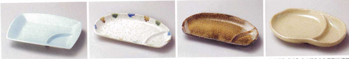
ア153-018 青白磁千代口5.0パーティール皿 18.3×13.8×2.7cm(磁)JPN 1,250円 タ153-028 三彩半月仕切皿 23.7×12.7×3cm(陶)JPN 1,240円 タ153-038 黄河半月仕切皿 23.7×12.7×3cm(陶)JPN 1,240円 ネ153-048 うす茶うのふ変形仕切皿 17.4×12.2×2.6cm(磁)JPN 1,100円