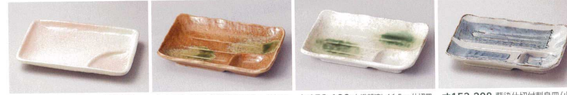
ヤ153-178 桜志野6.0仕切皿 17.5×12×2.1cm(磁)JPN 610円 ヤ153-188 伊賀織部16.5cm 仕切皿 16.7×11.5×2.8cm(磁)JPN 600円 ヤ153-198 白織部流し16.5cm 仕切皿 16.7×11.5×2.8cm(磁)JPN 600円 オ153-208 藍染仕切付刺身皿(小) 16.7×11.2×2.7cm(磁)JPN 650円