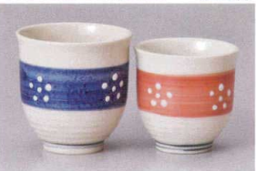
ト386-438 スプリングGフリーカップ小 φ7.8×9.6cm(210cc) (磁) JPN 580円 ト386-448 スプリングOフリーカップ φ7.8×9.6cm(210cc) (磁) JPN 580円