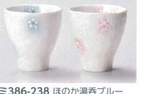
ミ386-238 ほのか湯呑ブルー φ7.8×8.2cm(磁) JPN 1,150円 ミ386-248 ほのか湯呑ピンク φ7.8×8.2cm(磁) JPN 1,150円