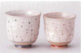
ア386-118 粉引木立湯呑大 φ8×7.8cm(220cc) (陶) JPN 1,100円 ア386-128 粉引木立湯呑小 φ7.5×7.2cm(180cc) (陶) JPN 1,000円