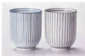
□386-018 呉須細十草 湯呑 φ6.6×7.8cm(160cc) (磁) JPN 1,180円 □386-028 錆細十草 湯呑 φ6.6×7.8cm(160cc) (磁) JPN 1,180円