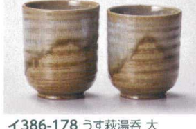
イ386-178 うす萩湯呑 大 φ7.4×8.6cm(200cc) (陶) JPN 1,100円 イ386-188 うす萩湯呑 小 φ7×8.2cm(180cc) (陶) JPN 1,100円