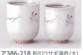
ア386-218 粉引ウサギ湯呑(大) φ7.4×8.5cm(230cc) (陶) JPN 1,000円 ア386-228 粉引ウサギ湯呑(小) φ7×8cm(190cc) (陶) JPN 1,000円