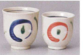
□386-318 丸紋(新)青湯呑(大) φ8.2×8.3cm(240cc) (磁) JPN 970円 □386-328 丸紋(新)赤湯呑(小) φ7.7×7.1cm(180cc) (磁) JPN 850円