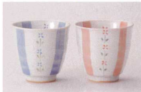
ア386-098 花十草湯呑青 φ8×7.8cm(210cc) (陶) JPN 1,200円 ア386-108 花十草湯呑赤 φ8×7.8cm(210cc) (陶) JPN 1,200円