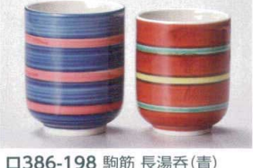
□386-198 駒筋 長湯呑(青) 6.5×8.3cm(160cc) (強) JPN 1,100円 □386-208 駒筋 長湯呑(赤) 6.2×7.8cm(160cc) (強) JPN 1,740円