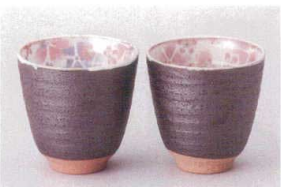
ハ386-038 粉引舞桜湯呑(紫) φ8.3×8cm(220cc) (陶) JPN 1,350円 ハ386-048 粉引舞桜湯呑(ピンク) φ8.3×8cm(220cc) (陶) JPN 1,350円