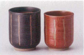
□386-278 紺十草長湯呑(大) φ6.8×8.4cm(220cc) (陶) JPN 950円 □386-288 赤十草長湯呑(小) φ6.5×7.6cm(160cc) (陶) JPN 880円