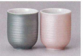
ホ386-478 灰志野十草湯呑(小) φ5.9×7.7cm(115cc) (陶) JPN 470円 ホ386-488 赤志野十草湯呑(小) φ5.9×7.7cm(115cc) (陶) JPN 470円