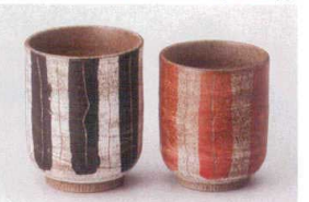
□386-158 線彫十草黒湯呑(大) φ6.8×8.4cm(220cc) (陶) JPN 1,140円 □386-168 線彫十草赤湯呑(小) φ6.5×7.6cm(160cc) (陶) JPN 1,030円