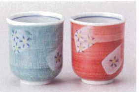
ア386-298 グリーン花ガスミ湯呑 φ7.1×8cm(190cc) (磁) JPN 900円 ア386-308 赤花ガスミ湯呑 φ6.8×7.5cm(180cc) (磁) JPN 780円