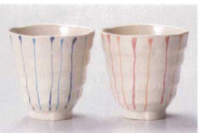
□386-058 十草一珍湯呑み(ブルー) φ8×8cm(190cc) (陶) JPN 1,100円 □386-068 十草一珍湯呑み(ピンク) φ8×8cm(190cc) (陶) JPN 1,100円