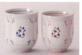
ア386-078 せねこ湯呑青 φ7.2×8.5cm(230cc) (陶) JPN 1,100円 ア386-088 せねこ湯呑赤 φ7×8cm(190cc) (陶) JPN 1,100円