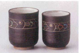
□386-138 魚湯呑(大) φ6.8×8.4cm(220cc) (陶) JPN 1,140円 □386-148 魚湯呑(小) φ6.5×7.6cm(160cc) (陶) JPN 1,030円