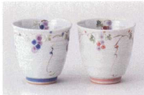
ア386-258 三彩ぶどう青長湯呑 φ8×7.8cm(210cc) (陶) JPN 950円 ア386-268 三彩ぶどう赤長湯呑 φ8×7.8cm(210cc) (陶) JPN 950円