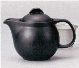
ア393-018 シンプルサークル黒マットポット大 φ11×18×13cm(620cc) (磁) JPN 3,400円