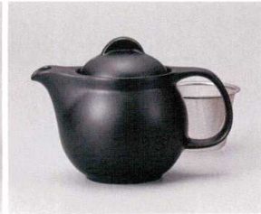
ア393-028 シンプルサークル黒マットポット小 φ10.5×15.5×11.5cm(440cc) (磁) JPN 2,800円