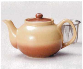
ハ393-148 Sha-La-Laポット(U) 500cc(陶) CHN 3,900円