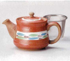
コ393-118 清流赤ポット(小)アミ付 16×10×9.5cm(330cc) (陶) JPN 4,290円