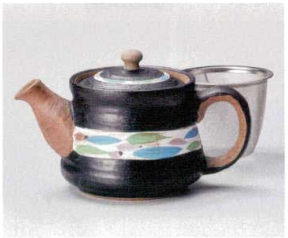
コ393-108 清流黒ポット(小)(アミ付) 16×10×9.5cm(330cc) (陶) JPN 4,290円