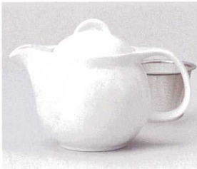
ア393-038 シンプルサークル白ポット大 φ11×18×13cm(620cc) (磁) JPN 3,400円