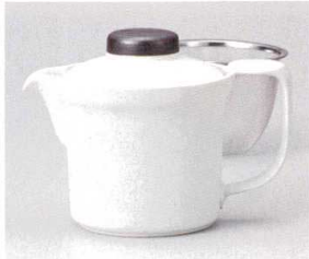
ヨ393-088 白マット広口ポット 16×10.5×11.5cm(400cc) (陶) JPN 2,800円