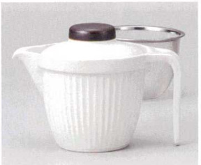
ヨ393-068 嵯峨野ポット 白マット 16×11×11.5cm(350cc) (陶) JPN 2,800円