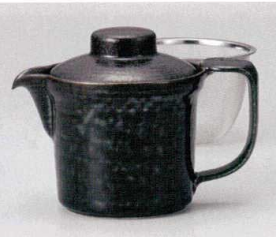
ヨ393-078 紺イラボ広口ポット 16×10.5×11.5cm(400cc) (陶) JPN 2,800円