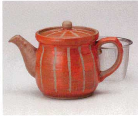
コ393-128 赤十草ポット 16×9.5×11.5cm(460cc) (陶) JPN 4,120円