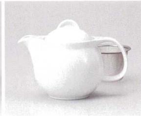
ア393-048 シンプルサークル白ポット小 φ10.5×15.5×11.5cm(440cc) (磁) JPN 2,800円