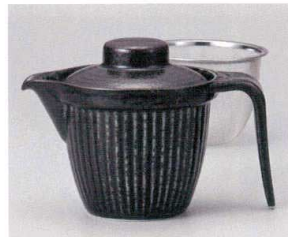
ヨ393-058 嵯峨野ポット 紺イラボ 16×11×11.5cm(350cc) (陶) JPN 2,800円