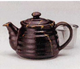
ア393-158 ビードロポット(茶コシ付) 17.6×11.2×10.8cm(450cc) (磁) JPN 2,700円