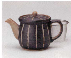
コ393-138 紺十草ポット 16×9.5×11.5cm(460cc) (陶) JPN 4,120円