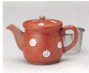
ア393-098 赤いろはポット(茶コシ付) 17×9.5×11cm(500cc) (陶) JPN 4,600円