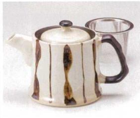
ヨ393-168 サビ十草ポット 18×11×12cm(510cc) (陶) JPN 2,600円