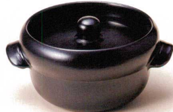
×407-038 4合ごはん土釜 33×28×26.5cm JPN