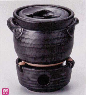
ス407-108 黒油ご飯釜(1合炊) 15×φ12×11cm(身10cm) (陶) (萬古焼) JPN 6,000円