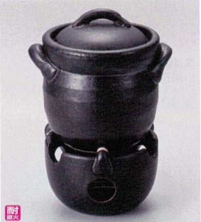
ス407-128 黒油ミニご飯釜(0.5合炊) 11×φ10×12cm(身9.5cm) (陶) (萬古焼) JPN 5,300円