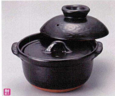
ヨ407-088 ぶち2.0合炊きご飯鍋 20.5×18×14cm(陶)MYS 4,550円