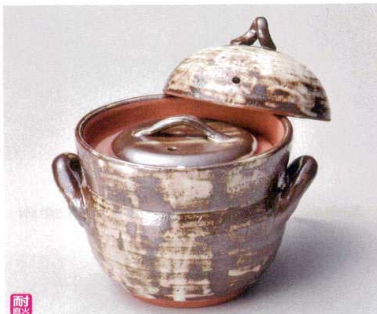
ス407-068 唐津刷毛目ご飯鍋2合炊(中蓋付) 22.5×φ16.5×20cm(身13.7cm) (陶) (萬古焼) JPN 9,500円