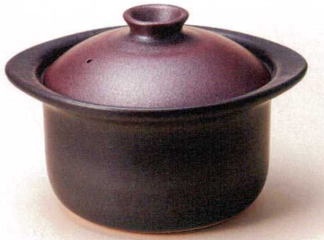
×407-018 鉄赤五合御飯鍋 28×24×18cm JPN