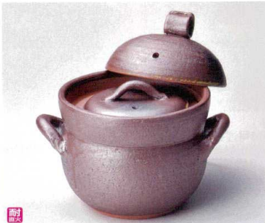
ス407-078 南蛮黒吹ご飯鍋2合炊(中蓋付) 22.5×φ16.5×20cm(身13.7cm) (陶) (萬古焼) JPN 9,500円