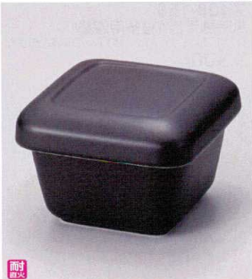
ス407-168 黒油飯櫃(めしびつ)2合用 16×16×11cm (萬古焼) JPN 5,800円