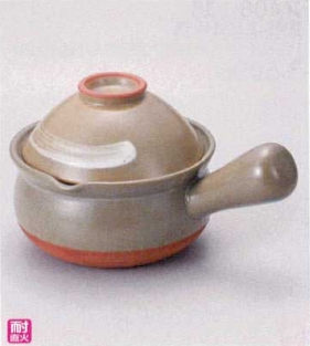
ス407-188 京風白刷毛目碗付行平 17×φ15×12cm(身8cm) (陶) (萬古焼) JPN 6,000円