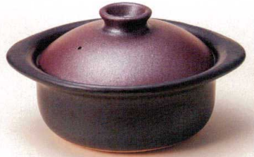
×407-028 鉄赤三合御飯鍋 28×24×15cm JPN