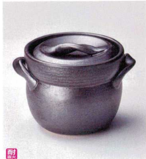
ス407-098 黒油ご飯釜(2合炊) 17×φ15×13.5cm(身13cm) (陶) (萬古焼) JPN 11,000円