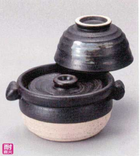
ス407-148 黒陶茶碗付ご飯鍋1合炊(中蓋付) 18×φ15×15cm(身8.8cm) (陶) (萬古焼) JPN 5,600円