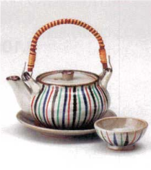
耐熱 ス415-098 十草土瓶むし φ11.5×6.3cm(320cc) (陶) (萬古焼) JPN 5,000円