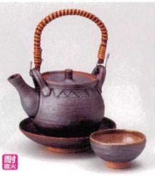
耐熱 ×415-038 南蛮丸型土瓶むし 13×9×8cm(230cc) (陶) JPN 6,300円