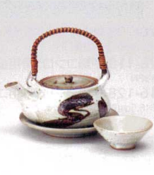
耐熱 ス415-138 錆刷毛絵土瓶むし φ10.8×6.5cm(280cc) (陶) (萬古焼) JPN 4,700円