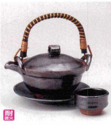
耐熱 ス415-048 鉄結晶型土瓶むし(超耐熱・手造り) φ12.4×9.2cm(260cc) (陶) (萬古焼) JPN 7,000円