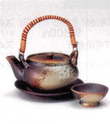
耐熱 ス415-148 備前風土瓶むし φ11.5×6.3cm(320cc) (陶) (萬古焼) JPN 4,200円