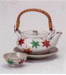
耐熱 ス415-088 もみじ土瓶むし φ11.5×6.3cm(320cc) (陶) (萬古焼) JPN 5,000円