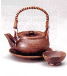
耐熱 ス415-158 伊賀土瓶むし φ11.5×6.3cm(320cc) (陶) (萬古焼) JPN 4,200円