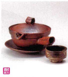
耐熱 ス415-058 焼締急須型土瓶むし(超耐熱・手造り) φ12.8×10cm(260cc) (陶) (萬古焼) JPN 7,200円