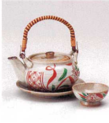
耐熱 ス415-108 赤絵万磨土瓶むし φ11.5×6.3cm(320cc) (陶) (萬古焼) JPN 5,000円