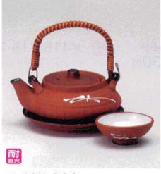
耐熱 ス415-228 耐熱松葉土瓶むし φ11.8×6.3cm(240cc) (陶) CHN 3,300円