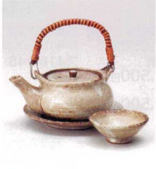
耐熱 ス415-128 むさしの丸土瓶むし φ10.8×6.5cm(280cc) (陶) (萬古焼) JPN 4,700円