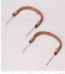
ス415-268 土瓶むし用一本ツル(細) 26cm etc. 230円 ス415-278 土瓶むし用一本ツル(太) 26cm etc. 260円