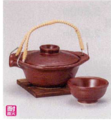
耐熱 ス415-068 鉄赤平形土瓶むし 15.8×13.2×5.2cm(250cc) (陶) (萬古焼) JPN 4,800円