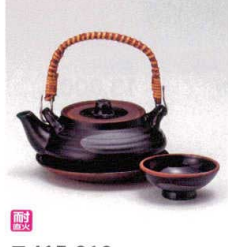
耐熱 ス415-218 天目平丸土瓶むし(耐熱) φ11.8×6.3cm(240cc) (陶) CHN 3,300円