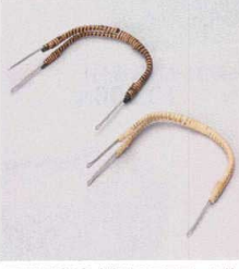
ス415-248 土瓶むし用三又ツル茶 31cm etc. 360円 ス415-258 土瓶むし用三又ツル白 31cm etc. 360円