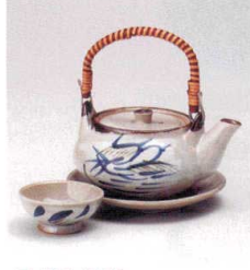
耐熱 ス415-168 芦絵土瓶むし φ11.5×6.3cm(320cc) (陶) (萬古焼) JPN 4,200円