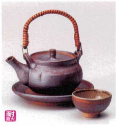
耐熱 ×415-028 南蛮花型土瓶むし 14×10×7.5cm(270cc) (陶) JPN 6,500円