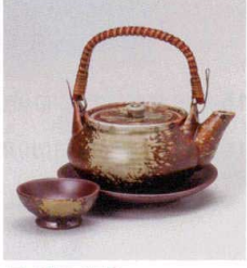
耐熱 ス415-178 灰釉土瓶むし φ11.5×6.3cm(320cc) (陶) (萬古焼) JPN 4,200円