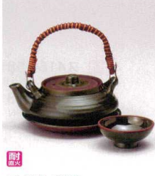
耐熱 ス415-208 織部平型土瓶むし(耐熱) φ11.8×6.3cm(240cc) (陶) CHN 3,300円