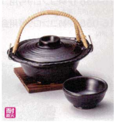
耐熱 ス415-078 黒釉平形土瓶むし 15.8×13.2×5.2cm(250cc) (陶) (萬古焼) JPN 4,800円