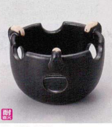
耐熱 ス415-238 黒釉耐熱ミニコンロ φ9.8×6.8cm(陶) (萬古焼) JPN 3,800円