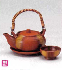
耐熱 ス415-198 鉄彩丸型土瓶むし(耐熱) φ10.8×6.8cm(320cc) (陶) CHN 3,800円