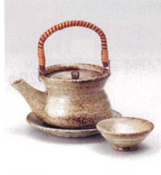
耐熱 ス415-118 むさしの巾着土瓶むし φ10×7.5cm(280cc) (陶) (萬古焼) JPN 4,700円