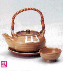
耐熱 ス415-188 イラボ丸型土瓶むし(耐熱) φ10.8×6.8cm(320cc) (陶) CHN 3,800円