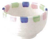
ツ466-528 5.0多用丼 φ16×10.5cm(磁)JPN 2,300円