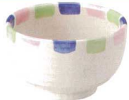
ツ466-518 6.0高台丼 φ18×11.5cm(磁)JPN 2,600円