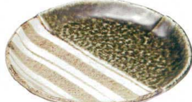
□466-218 9.0丸皿 φ28.5×2.4cm(陶)JPN 4,530円