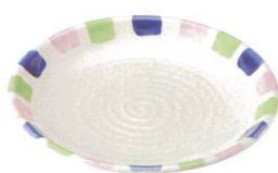
ツ466-578 丸9.0皿 φ27×3.3cm(磁)JPN 2,800円