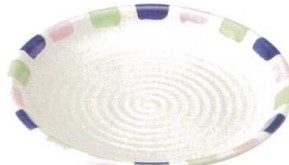
ツ466-588 丸尺皿 φ31×3.8cm(磁)JPN 6,000円