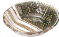
□466-028 6.5丸鉢 φ19×4.5cm(陶)JPN 2,840円