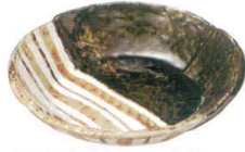
□466-018 7.5丸鉢 φ23×4.5cm(陶)JPN 3,740円