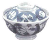
≪486-368 5.0蓋弁 φ15.6×11.3cm(磁)JPN 2,250円