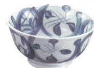
≪486-388 5.5深口弁 φ16.8×8.3cm(磁)JPN 2,150円