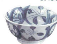
≒486-388 5.5深口弁 φ16.8×8.3cm(磁)JPN 2,150円