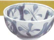
≪486-338 5.5深ボール φ17.2×8.7cm(磁)JPN 2,750円