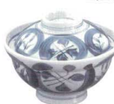
≒486-368 5.0蓋弁 φ15.6×11.3cm(磁)JPN 2,250円