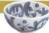
≪486-348 6.0深ボール φ18.7×9cm(磁)JPN 3,450円