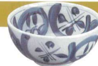
≒486-348 6.0深ボール φ18.7×9cm(磁)JPN 3,450円