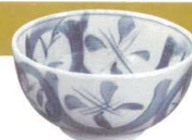
≒486-338 5.5深ボール φ17.2×8.7cm(磁)JPN 2,750円