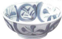
≒486-358 7.0腰張弁 φ22×8.7cm(磁)JPN 3,800円