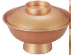
I694-058 [A] 8寸大名井椀総金雅 φ23×14.8cm(1700cc) JPN(段無) 10,000円