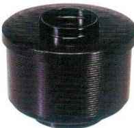
I694-248 [TA] 千筋飯器 黒内朱 洗 φ11.6×9cm・内寸10.2×6.7cm(520cc) JPN(段無) 1,100円