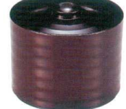
I694-218 [A] 昇月飯器 溜 φ9.5×7.7cm(220cc) JPN 1,600円