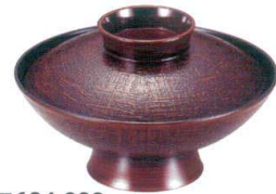
I694-088 [TA] 5.5寸煮物椀 栃布目 洗 φ16.7×10.1cm(500cc) JPN(段無) 2,700円