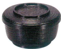
I694-198 [TA] (小) 割子飯器 黒 洗 φ12.3×7.6cm・内寸10.9×5.1cm(400cc) JPN(段無) 800円