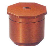
I694-298 [A] 江戸飯器 金梨地内朱 1段 φ12.3×11.4×8.6cm・内寸10.7cm(500cc) JPN 1,600円

[A] ABS樹脂・熱可塑性樹脂 [TA] 耐熱ABS樹脂 [洗淨機可] 洗 洗淨機を利用される場合、設定温度を80℃以下でお願いします。