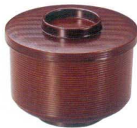
I694-258 [TA] 千筋飯器 栃内黒塗 洗 φ11.6×9cm・内寸10.2×6.7cm(520cc) JPN(段無) 1,500円