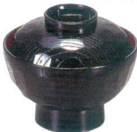
I694-148 [TA] (中) 龜甲井椀 黒内朱 洗 φ13.3×11.7cm(380cc) JPN 1,550円