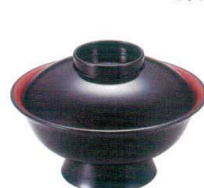
I694-158 [A] (大) 龜甲井椀 黒内朱 φ15.6×13.8cm(580cc) JPN 1,550円