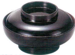
I694-108 [A] 5.5寸大平椀 黒内朱天黒 厚型 φ16.6×9.5cm(430cc) JPN 1,500円