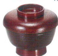
I694-178 [A] 高台かぶせ木目椀 栃 φ15.2×12.5cm(770cc) JPN(段無) 2,150円