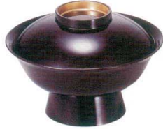
I694-038 [A] 6寸大名椀 溜つば金 φ18×12.4cm(800cc) JPN 2,800円