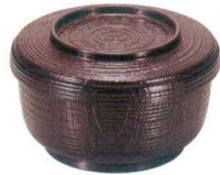
I694-208 [TA] (小) 割子飯器 溜内朱塗 洗 φ12.3×7.6cm・内寸10.9×5.1cm(400cc) JPN(段無) 980円