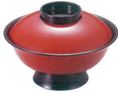
I694-018 [A] 5.5寸低型大名椀 朱つば黒 φ16.3×10.9cm(600cc) JPN(段無) 2,900円