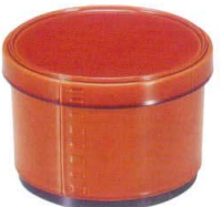
I694-268 [TA] (中) メンバ飯器 春慶内黒塗 洗 φ11.8×8.1cm・内寸10.1×6.6cm(500cc) JPN(段無) 1,900円