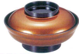
I694-128 [A] 新広輪井(小) 金梨地つば黒 φ17.6×9.8cm(440cc) JPN 2,500円