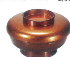
I694-188 [A] かぶせ井 梨地内朱 φ17.5×10.5cm(720cc) JPN(段無) 2,400円