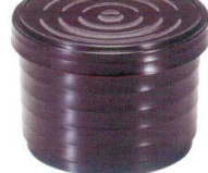
I694-228 [TA] (小) ロク口飯器 溜内朱 洗 φ10.5×7.6cm・内寸9×5.9cm(360cc) JPN(段無) 1,800円