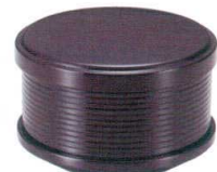
I694-238 [TA] かぶせ千筋飯器新溜内朱塗(裏底塗) 洗 φ10.6×6.8cm(330cc) JPN 1,700円