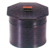
I694-278 [A] 3寸武蔵野椀 黒刷毛内朱 1段 φ11×8cm・内寸8.9×6.1cm(500cc) JPN(段無) 1,700円