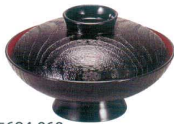
I694-068 [TA] 5.5寸小槌木目椀 黒内朱 洗 φ16.7×10.1cm(500cc) JPN(段無) 2,500円