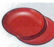
E706-248 [A]ダブル薬味皿 朱天黒 12.5×9×1.5cm JPN 800円