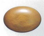
E706-078 [A]5寸平丸皿 金雲流裏黒 φ15×1.5cm JPN 1,400円