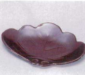
E706-098 [A]松葉皿 溜 17.8×11.5×2cm JPN 1,200円