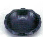
E706-058 [A]4寸D.X亀甲茶托 黒 φ12×2.8cm JPN 750円