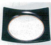
E706-238 [TA]四方上り角鉢吹墨 洗 11.3×11.3×2.4cm・穴内寸φ8.5cm JPN 1,300円