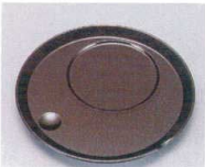
E706-198 [A]丸茶碗蒸し台 梨地 φ12.5×1.3cm・穴内寸φ6.2cm JPN 550円