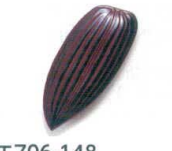
E706-148 [A](小)笹皿 溜 15×7×1.2cm JPN 850円