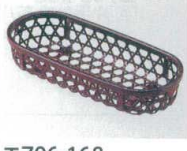
E706-168 [A]18.5寸長手愛染かご おしぼり入れ 溜(3人用) 24.8×11×4.4cm JPN 1,300円