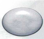
E706-088 [A]5寸平丸皿 銀雲流裏黒 φ15×1.5cm JPN 1,400円