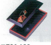
E706-188 [A]徳川のり入れ 黒扇面 16×7.5×2.8cm JPN 1,500円