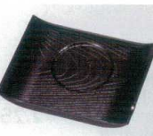
E706-218 [A]羽反木目茶碗むし台 新溜 13×9.8×1.8cm・穴内寸φ5.7cm JPN 750円