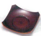
E706-028 [A]隅切茶托 柘 9.5×9.5×2.2cm・穴内寸φ5.4cm JPN 850円