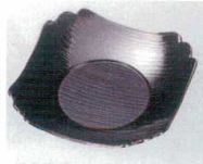
E706-048 [A]花型茶托 溜 φ10×10×2.1cm・穴内寸φ5.5cm JPN 850円