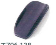
E706-138 [A]富士おしぼり入れ 黒 19×7.3×2.5cm JPN 500円