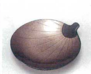
E706-108 [A]うちわ菓子皿 錦パール天黒 14.7×13.7×2.4cm JPN 750円