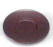
E706-038 [A]平茶托 溜 φ11.5×1cm・穴内寸φ5cm JPN 750円