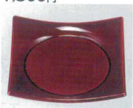
E706-228 [TA]四方上り角鉢溜 洗 11.3×11.3×2.4cm・穴内寸φ8.5cm JPN 1,200円