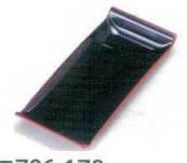
E706-178 [A]のり皿 黒天朱 17.8×8×2.2cm JPN 950円