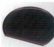
E706-128 [A]16寸半月銘々皿 溜 16.5×15.8×1cm JPN 1,700円