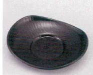
E706-018 [A]小判茶托 黒木目 12.3×10.4×2.3cm・穴内寸φ4.6cm JPN 600円