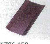
E706-158 [A](小)千筋おしぼり入れ 溜 18.2×8.9×1.1cm JPN 900円