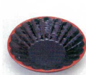
E706-068 [A]菊型茶托 黒天朱 φ12×2.3cm・穴内寸φ5.5cm JPN 850円