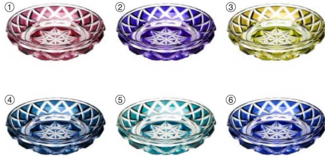
26-109-01 (134048) 薩摩切子伝匠 小皿 A (金赤) 本体寸法: Φ9xH2.8cm ガラス 26-109-02 (134049) 薩摩切子伝匠 小皿 A (金紫) 本体寸法: Φ9xH2.8cm ガラス 26-109-03 (134050) 薩摩切子伝匠 小皿 A (黄) 本体寸法: Φ9xH2.8cm ガラス 26-109-04 (134051) 薩摩切子伝匠 小皿 A (藍) 本体寸法: Φ9xH2.8cm ガラス 26-109-05 (134052) 薩摩切子伝匠 小皿 A (緑) 本体寸法: Φ9xH2.8cm ガラス 26-109-06 (134053) 薩摩切子伝匠 小皿 A (瑠璃) 本体寸法: Φ9xH2.8cm ガラス