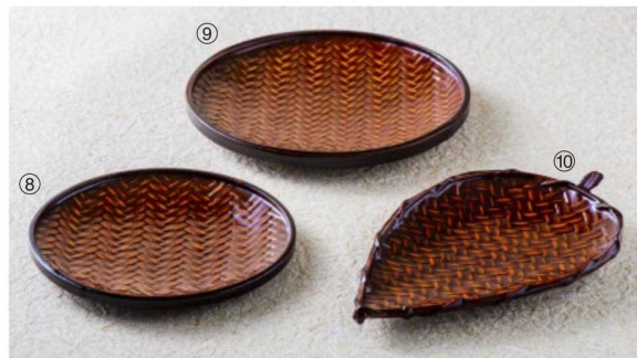
26-118-10 (412508) 籃胎木の葉型銘々皿(茶) 本体寸法: W17xD11xH1cm 竹/漆塗装