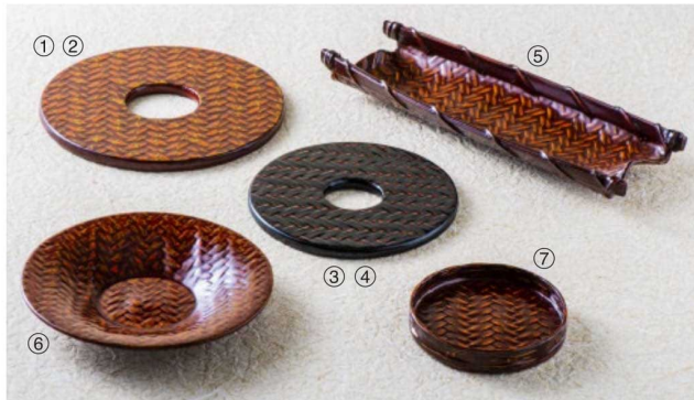
26-118-01 (412496) 籃胎急須敷(茶)(大) 本体寸法: Φ14xH0.6cm 竹/漆塗装