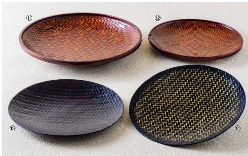
26-118-11 (412490) 籃胎盛鉢(茶) 本体寸法: Φ30xH5cm 竹/漆塗装