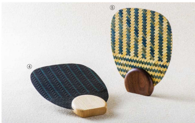
26-119-04 (412513) 籃胎うちわ(藍染) 本体寸法: W19xD25cm 竹/漆塗装