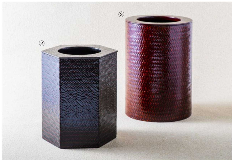
26-119-03 (412510) 籃胎丸ボックス(茶) 本体寸法: \Phi 22xH30cm 竹/漆塗装