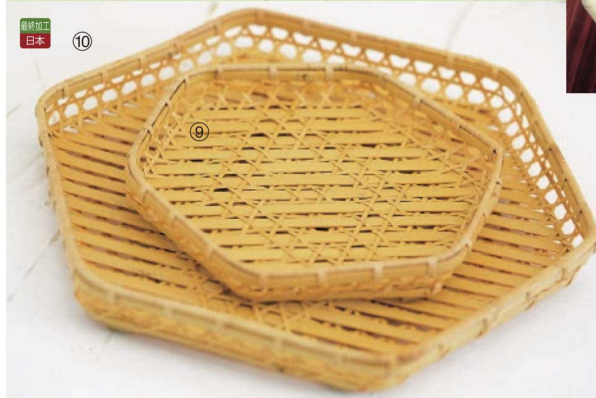
26-133-09 (712595B) 白竹六角銘々皿 ¥4,200 本体寸法:W20xD18xH3cm 竹