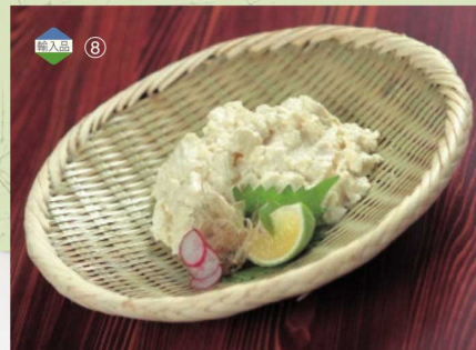
26-133-08 (40232) 青海丸皿(8寸) ¥3,800 本体寸法:Φ24xH2.5cm 竹 籐