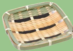
26-134-04 (28209) 線入四海波 ¥900 本体寸法: W19xD19xH2cm 竹