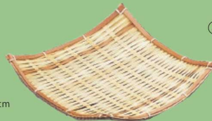
26-134-03 (712648) 染竹二重編四海波 ¥9,800 本体寸法: W19.5xD19.5xH3cm 竹