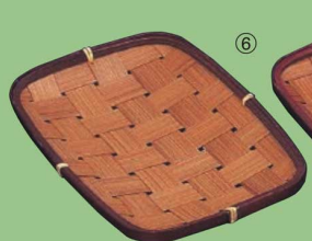
26-134-05 (712069C) 青ツマミ(角)(紋竹入) ¥1,350 本体寸法: W15xD15xH1cm 竹