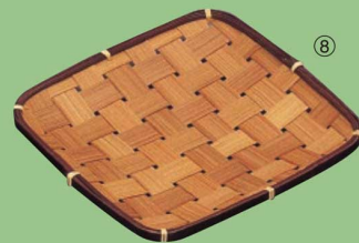
26-134-07 (181296) スス四ツ目(角長)(大) ¥1,200 本体寸法: W24xD16cm 竹