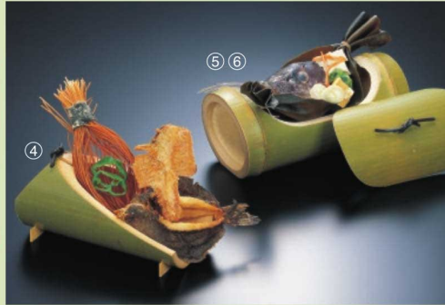
26-140-04 (28667) 長満月皿 ¥1,150 本体寸法: Φ10xH20cm 竹