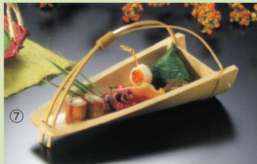
26-140-07 (18938) 舟型リング柄付 ¥1,500 本体寸法: W26xD13xH14cm 竹/ウレタン塗装