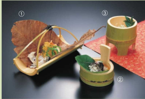
26-140-01 (28669) 青竹角長柄付 ¥1,400 本体寸法: W24xD11xH14cm 竹