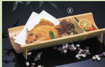
26-140-08 (181332) 青竹一節皿 ¥1,800 本体寸法: W33.5xD14xH5.5cm 竹/ウレタン塗装