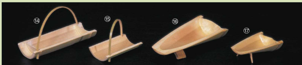
26-140-14 (28657) 竹柄二節皿 ¥1,000 本体寸法: W21xD8xH11cm 竹