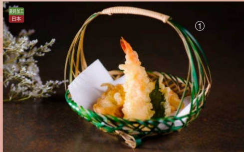
26-150-01 (713005) 青彩御殿籠手付 ¥1,850 本体寸法:Φ17.5xH17.5cm 竹