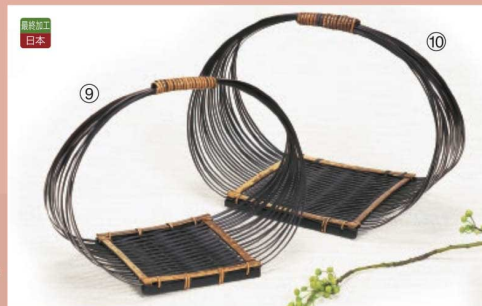
26-150-09 (288084) 虎淵結び籠(小) ¥2,300 本体寸法: W10.5xD10.5xH16cm 竹(受皿寸法)