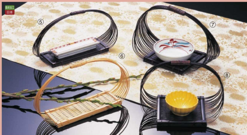
26-150-05 (28579) 染竹結び籠(角長) ¥2,300 本体寸法: W18.5xD6.5xH12cm 竹(受皿寸法)