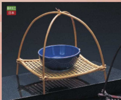
26-150-10 (288083) 虎淵結び籠(大) ¥2,500 本体寸法: W12.5xD12.5xH19cm 竹(受皿寸法)