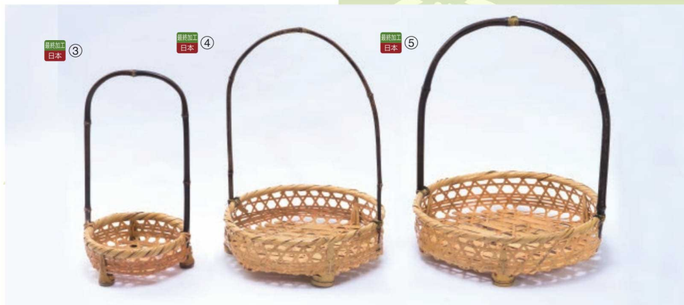
26-165-03 (183068) 白竹巻漉オードブル手付(小) ¥7,600 本体寸法: Φ18xH34.5cm 竹