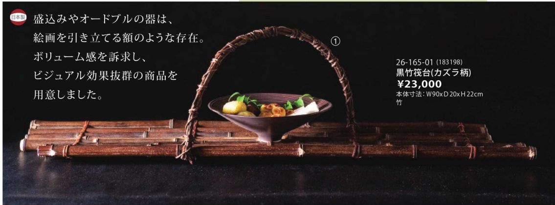
26-165-01 (183198) 黒竹筏台(カズラ柄) ¥23,000 本体寸法: W90xD20xH22cm 竹

盛込みやオードブルの器は、 絵画を引き立てる額のような存在。 ボリューム感を訴求し、 ビジュアル効果抜群の商品を 用意しました。