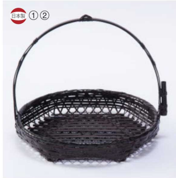
26-166-01 (28150) 染竹若菜籠(特大)(A) ¥8,000 本体寸法:Φ26xH26cm 竹