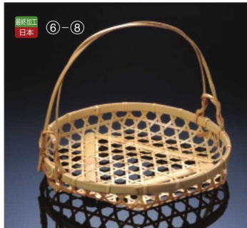
26-166-06 (281069) 白竹オードブル皿手付(8寸) ¥4,200 本体寸法:Φ24xH22cm 竹