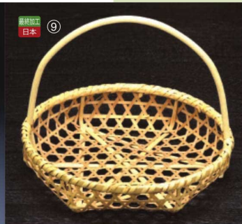
26-166-09 (711315) 白竹食彩籠 ¥5,800 本体寸法:Φ30xH37cm 竹