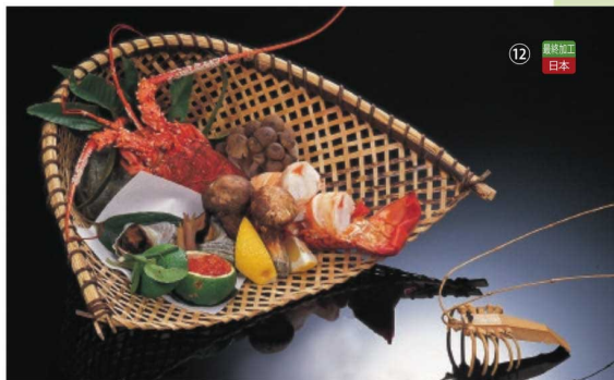
26-166-12 (28749) 虎竹箕型オードブル ¥9,000 本体寸法:W42xD30xH16cm 竹