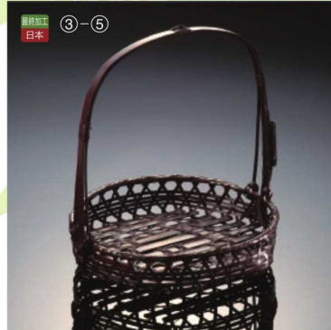
26-166-03 (281073) 染竹錦籠手付オードブル (8寸)一輪挿し付 ¥4,400 本体寸法:Φ24xH32cm 竹