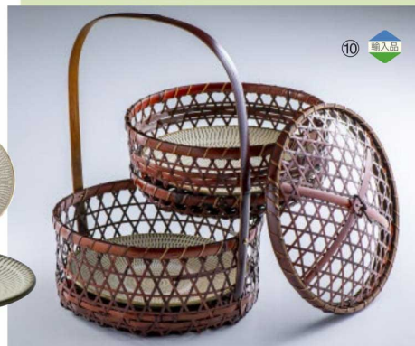
26-166-10 (712260) 茶染竹二段弁当 ※皿は別売です。 ¥19,800 本体寸法:Φ24xxH33cm ※7寸皿が丁度収まるサイズ 竹