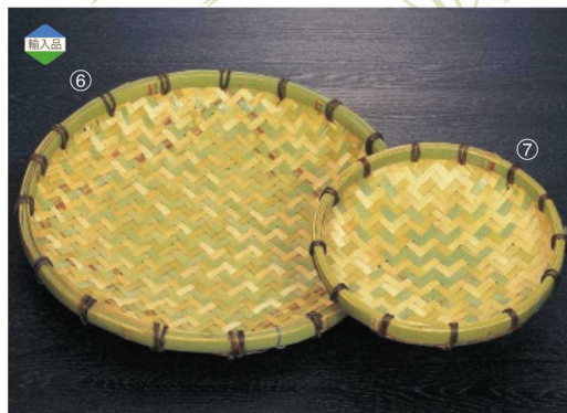
26-167-06 (31149) 青竹アジロ山菜皿(大) ¥8,600 本体寸法: Φ41xH6cm 竹