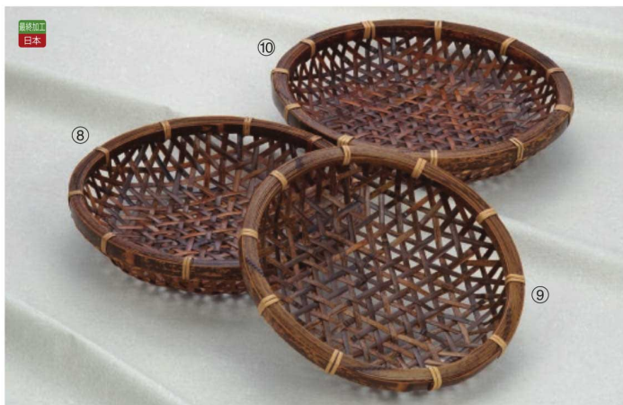
26-167-08 (75182) 虎竹麻の葉盛器(尺2) ¥6,000 本体寸法: Φ36xH8cm 竹