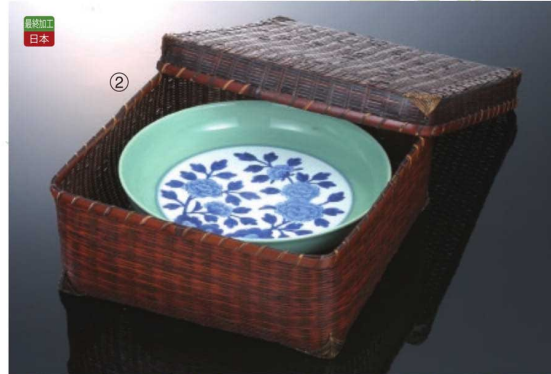
26-167-02 (71515) 茶染つづら籠 ¥22,000 本体寸法: W42xD42xH17cm 竹