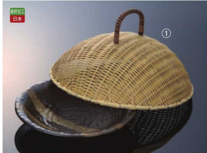
26-167-01 (183052) 竹製かぶせ籠 ¥12,000 本体寸法: Φ40xH20cm 竹 藤 ステンレス