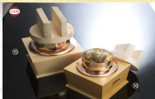
26-207-15 (551350) 銅製樋目5合釜セット 価格はお問合せ下さい。 本体寸法:W26.5xD26.5xH22.5cm 銅 木/容量2.8L