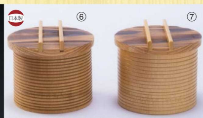
26-207-06 (32203) スス竹らせん丼 ¥4,600 本体寸法:Φ13xH10cm 竹 木/ウレタン塗装