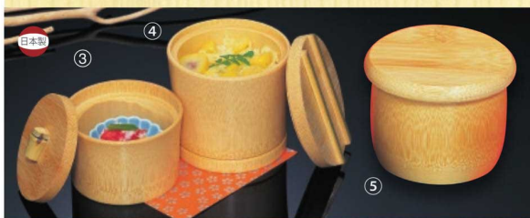
26-207-03 (18422) 白竹ロクロ飯器(A) ¥1,600 本体寸法:Φ8.5xH5.5cm 竹/ウレタン塗装