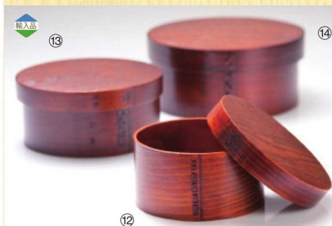
26-207-12 (32238) 曲げワッパ一人用飯器(目摺) ¥4,600 本体寸法:Φ15xH8cm 木/漆塗装