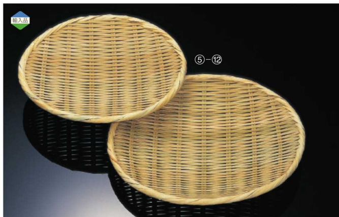
26-245-05 (40524) 盆ザル(並)(6寸) ¥580 本体寸法:Φ18xH2cm 竹 藤