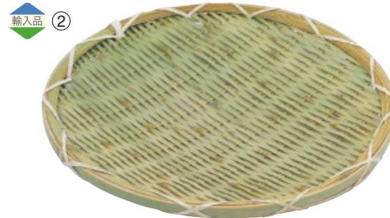
26-246-02 (712109) 青竹トレー(尺) ¥2,900 本体寸法:Φ30xH1cm 竹