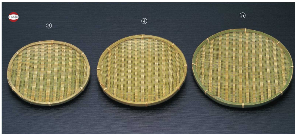
62-246-03 (31115) 青竹丸ザル(9寸) ¥1,800 本体寸法:Φ27xH3cm 竹