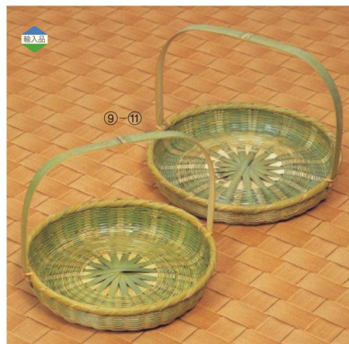
26-246-09 (287088) 青竹盛皿手付(8寸) ¥6,300 本体寸法:Φ24xH20cm 竹