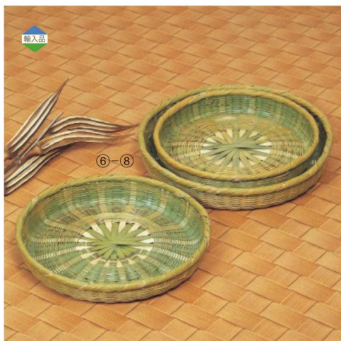
26-246-06 (287089) 青竹丸盛皿(8寸) ¥5,600 本体寸法:Φ24xH4.5cm 竹